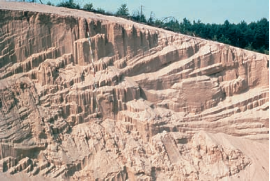
Abb. 5: Düne beim Hofe Gauksterdt/Kipshagen nordwestlich Stukenbrock, Abbau durch die Fa. Schlingmann (1966). Die beim Abbau angeschnittenen Schichten zeigen einen steilen Einfallwinkel zwischen 30 und 40 Grad Nord-Süd, welcher der nacheiszeitlichen Hauptwindrichtung SW-NO widerspricht. Die aus dem steilen Einfall der Schichten abzuleitende Schüttungsrichtung des Sandes führt zu der Folgerung, dass der maßgebliche Wind aus nördlicher Richtung kam und sich das aktuelle Relief der Düne (flacher Luv- und steiler Lee- hang) erst später (wann?) ausgebildet hat. Der die Düne abdeckende Boden ist zur Zeit der Aufnahme bereits abgeräumt.