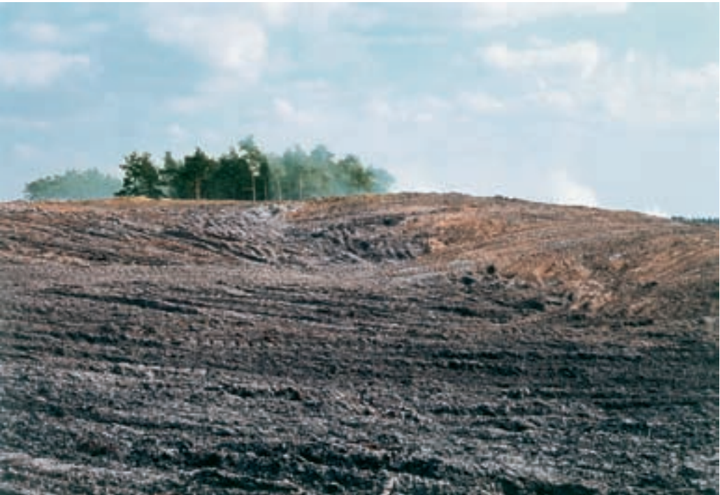
Abb. 9: Dünen nördlich des Krollbaches im Naturschutzgebiet "Moosheide" vor der Zerstörung durch den Bau der A 33 im Jahr 1982, eines von zahlreichen Beispielen für den Verlust charakteristischer Landschaftselemente, selten durch notwendige, jedoch vielfach auch durch willkürliche Eingriffe in das Landschaftsbild hervorgerufen.