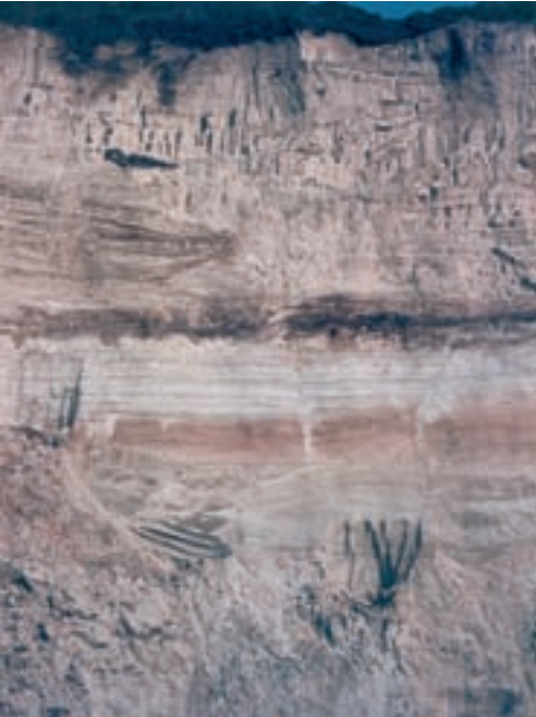
Abb. 8 (links): Düne an der L 758 zwischen Stukenbrock und Augustdorf, Abbau durch die Fa. Brink, Trockenabbau 1969 (später Abbau im Grundwasser: Baggersee). In den Basis-schichten von steil mit 30 bis 35 Grad NO-SW einfallenden Dünensanden konnte auch hier (vgl. Abb. 6) ein Podsol-Gley bzw. ein diesem verwandter fossiler Boden freigelegt werden. Bemerkenswert ist, dass in diesen senkrecht oder schräg aus den darüber sedimentierten Schichten Frostspalten hinein ragen. Deren Füllung mit eingesickertem Sediment hat in dem Boden keilförmige Streifen hinterlassen.