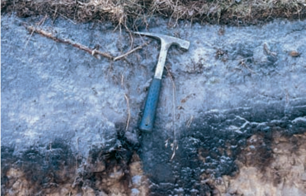
Abb 1: Humus-Eisen-Podsol am Rande des Industrie- und Gewerbegebietes Augustdorf (1992). Dieser Bodentyp ist auf Sandböden, die sich ohne Störung u. a. durch Ackerbau, Forstwirtschaft, Plaggenhieb und Baumaßnahmen während des seit einigen Jahrtausenden herrschenden Warmzeit-Klimas (im Holozän) entwickeln konnten, in Nordwestdeutschland weit verbreitet. Man findet ihn auch auf Dünen.

ten und allerlei Vermessungsgeräten be- waffnet, verfolgten sie den Abbau zahlrei- cher Dünen zuerst argwöhnisch, dann mit Leidenschaft. Welche Erkenntnisse sich ihnen boten, sei im Folgenden an einigen wenigen Beispielen erörtert (s. Abb. 1–8).