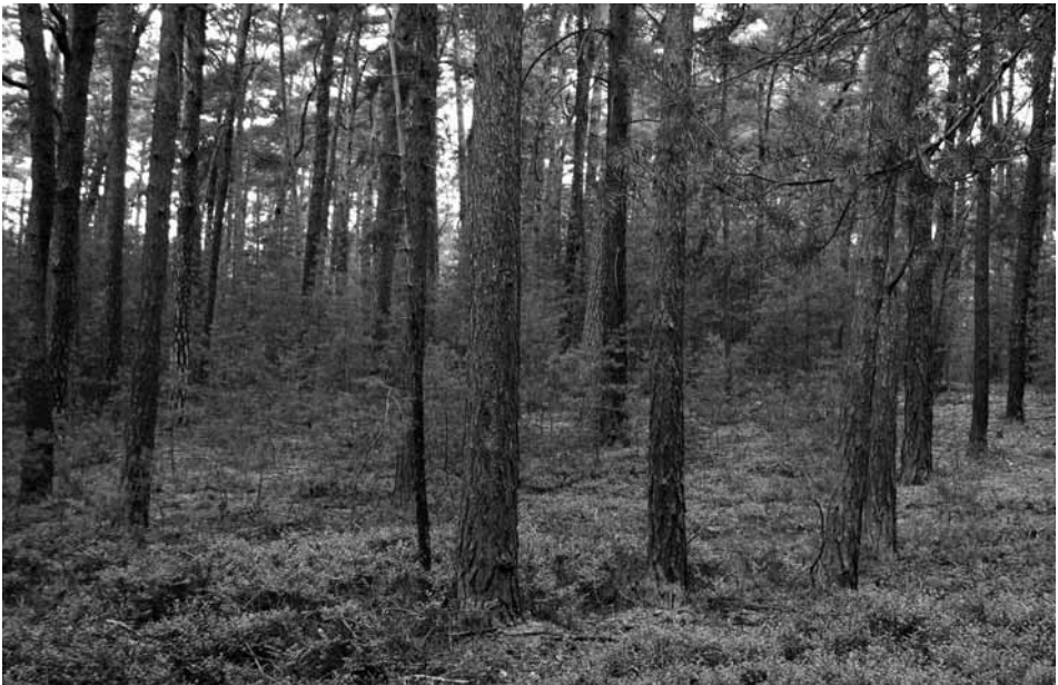
Abb. 4: Leucobryo-Pinetum mit Dominanz von Vaccinium myrtillus und V. vitis-idaea („Beerstrauch-Kiefernwald“) und Kiefern-Naturverjüngung. Sandsteingebiet des Polomé hory (Kummergebirge) am Machá-See, Nordböhmen.