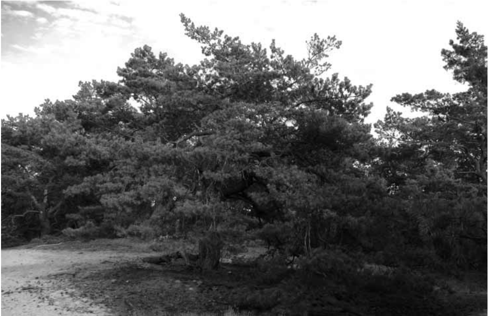
Abb. 2: Silbergras-Kieferngehölz ( Cladonio-Pinetum corynephoretosum ) in den Glauer Bergen, einem Endmoränenzug südlich von Potsdam. Typisch sind die schlecht wüchsigen Kiefern mit ausladenden Baumkronen und offene Bodenbereiche mit Wuchsmöglichkeiten für Sandtrockenrasen-Arten.