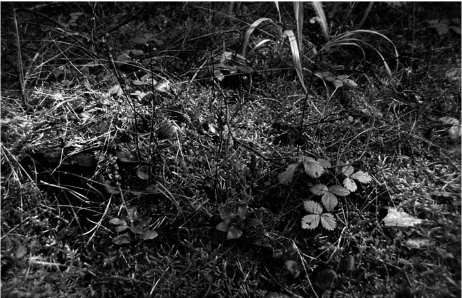
Abb. 6: Bodenvegetation eines Peucedano-Pinetum bei Rüdersdorf östlich von Berlin mit Brachypodium sylvaticum , Fragaria vesca , Orthilia secunda und Pyrola chlorantha in einer dichten Moosdecke aus Scleropodium purum .