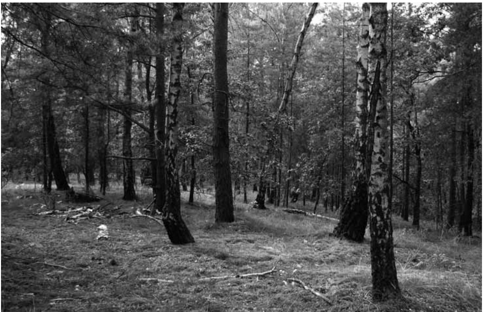
Abb. 5: Ein offenbar nicht gepflanzter, Birken-reicher Bestand des Leucobryo-Pinetum mit Dominanz von Deschampsia flexuosa und Festuca ovina agg. in den Glauer Bergen südlich von Potsdam. Solche Beerstrauch-freien Ausbildungen sind kennzeichnend für die Weißmoos-Kiefernwälder der trockensten Regionen wie Mittelbrandenburg.