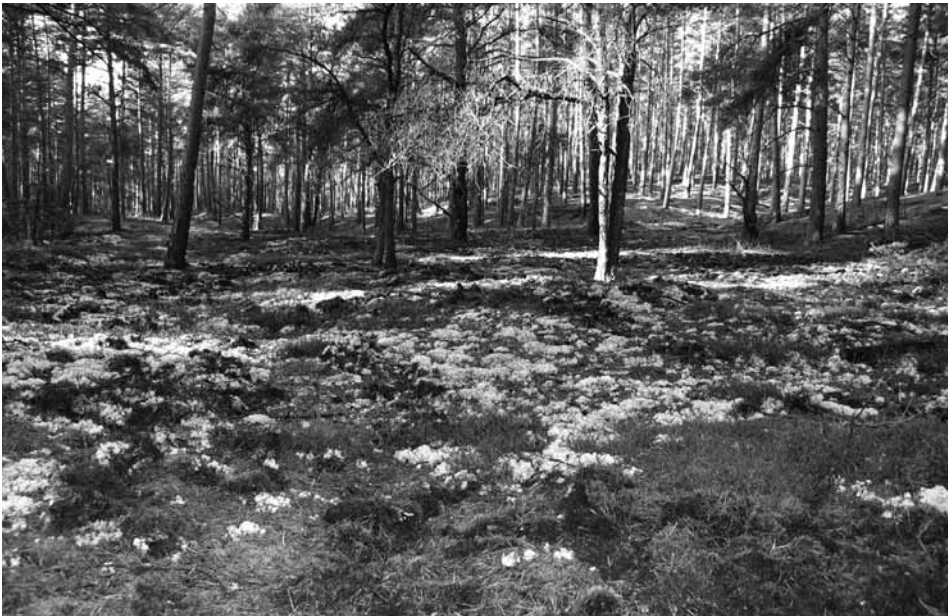
Abb. 3: Flechten-Kiefernwald des Cladonio-Pinetum typicum auf konsolidierten Standorten in den Wiener Bergen, einem Endmoränengebiet im östlichen Niedersachsen. Charakteristisch ist die dichte Moos- und Flechtendecke (hier vor allem Cladonia portentosa ), während Phanerogamen praktisch fehlen.