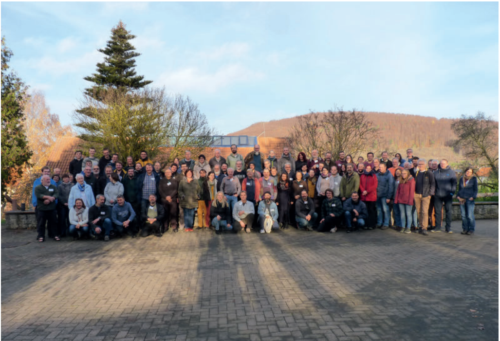
Abb. 1: Die Teilnehmer beim 8. Seminar „Beringung und Wiederfunde“ in der Bildungs- und Ferienstätte Eichsfeld, Uder in Thüringen. – Participants of the 8 th seminar „Beringung und Wiederfunde“ at the Bildungs- und Ferienstätte Eichsfeld, Uder in Thuringia, Germany.