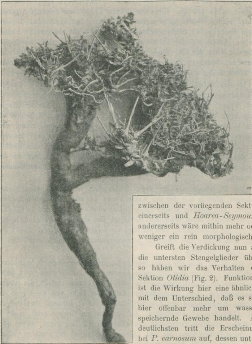
Fig. 2. Pelargonium crithmifolium Sweet.

ihrem Längsdurchmesser parallel zur Erdoberfläche liegen. Die Oberhaut ist vielfach zerrissen und von korkiger Beschaffenheit. Es steht nichts der Annahme entgegen, daß es sich auch bei der Knolle von Polyactium um die Verdickung des hypokotylen Gliedes handelt, und der Unterschied