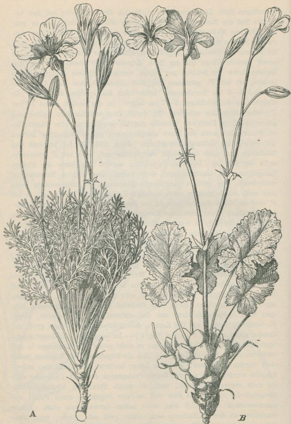
Fig. 4. A Pelargonium dissectum (Eckl. et Zeyh.) Harvey. — B P. orato-stipulatum R. Knuth.