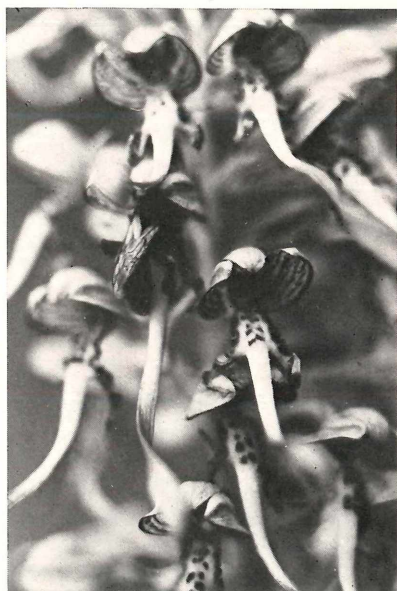
Abb. 1—3 : Himantoglossum hircinum am Ebelsberg