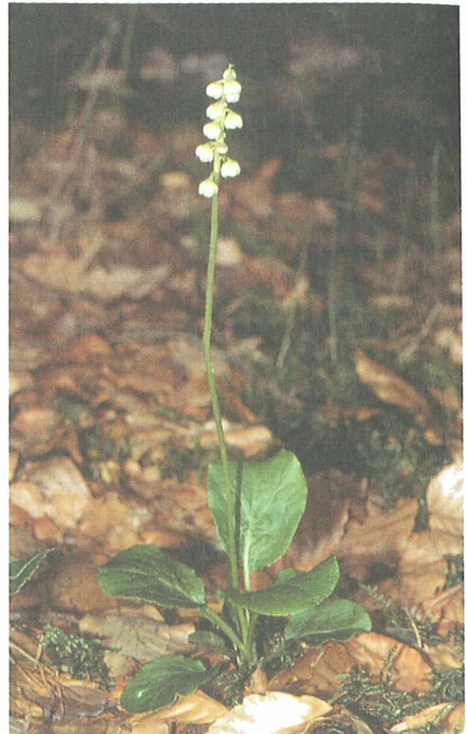
Abb. 5: Pyrola minor