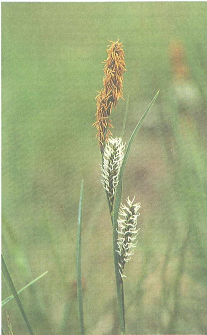
Abb. 4: Carex nigra