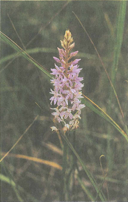
Abb. 2: Dactylorhiza fuchsii