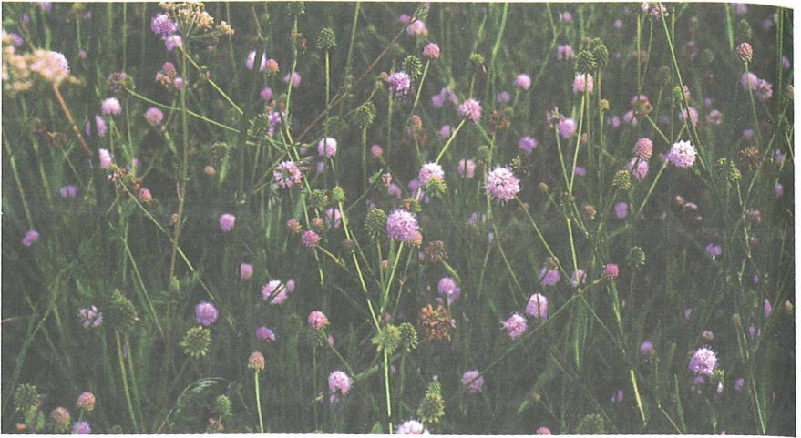
Abb. 1: Succisella inflexa