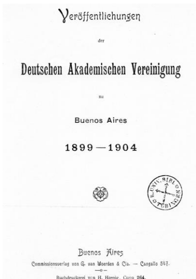
Abb. 1: Titelblatt von Band 1 der Veröffentlichungen der Deutschen Akademischen Vereinigung in Buenos Aires 1899-1904.