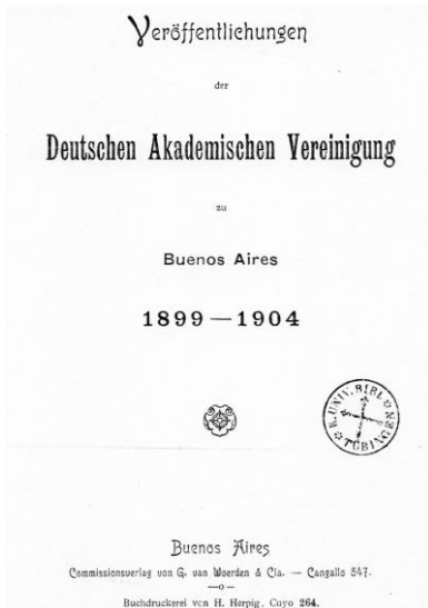
Abb. 1: Titelblatt von Band 1 der Veröffentlichungen der Deutschen Akademischen Vereinigung in Buenos Aires 1899-1904.