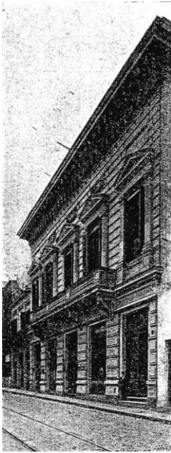
Abb. 5: Ansicht des Deutschen Hauses (Sitz des Deutschen Wissenschaftlichen Vereins in Buenos Aires) in der Moreno-Straße Nr. 1059. Aus der Vereinszeitschrift 1904.