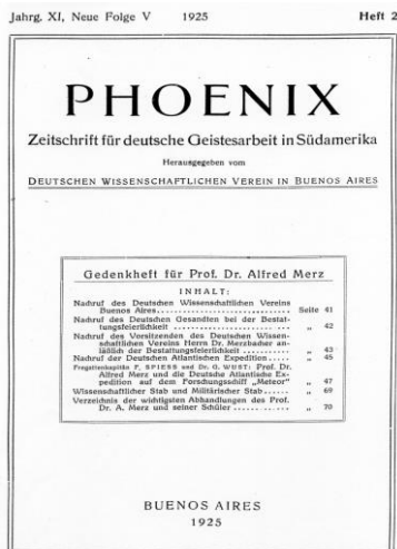
Abb. 3: Titelblatt der Zeitschrift Phoenix für deutsche Geistesarbeit in Südamerika, Buenos Aires, 1925