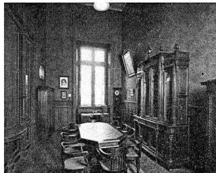
Abb. 8: Sitzungszimmer des Deutschen Wissenschaftlichen Vereins im Deutschen Haus in Buenos Aires. Aus der Vereinszeitschrift.