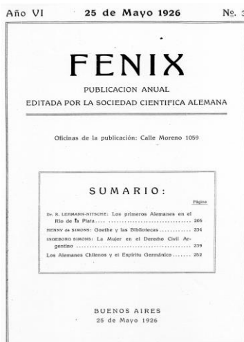
Abb. 4: Titelblatt der Zeitschrift Fenix, Editada por la sociedad científica alemana, Buenos Aires, 1926