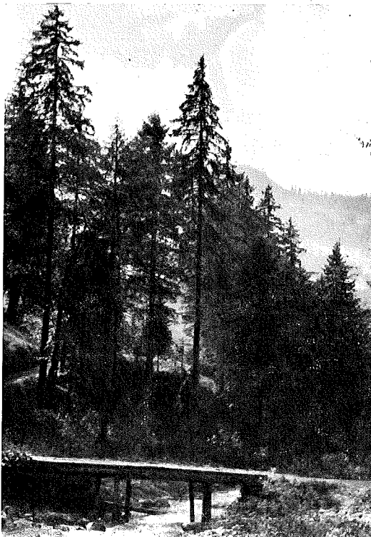
Abb. 1. Subalpiner Mischwald mit hohem Koniferen-Anteil. Man erkennt den mehrschichtigen Aufbau des Waldes aus verschiedenen Altersklassen. Kronen von ungleicher Höhe.