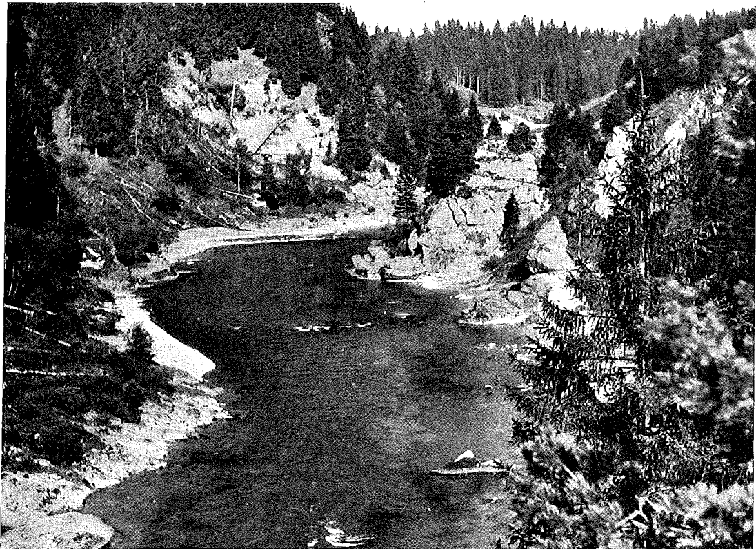
Lech-Durchbruch bei Roßhaupten