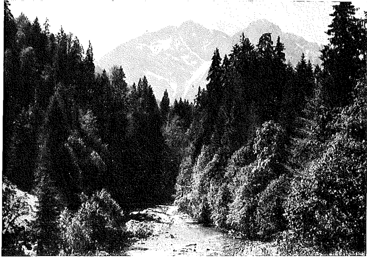
Abb. 2. Subalpiner Buchen-Mischwald an den Hängen des tief eingeschnittenen Breitachtals. Unmittelbar am Ufer Auenwaldstreifen mit vorherrschender Grauerle ( Alnetum incanae ).