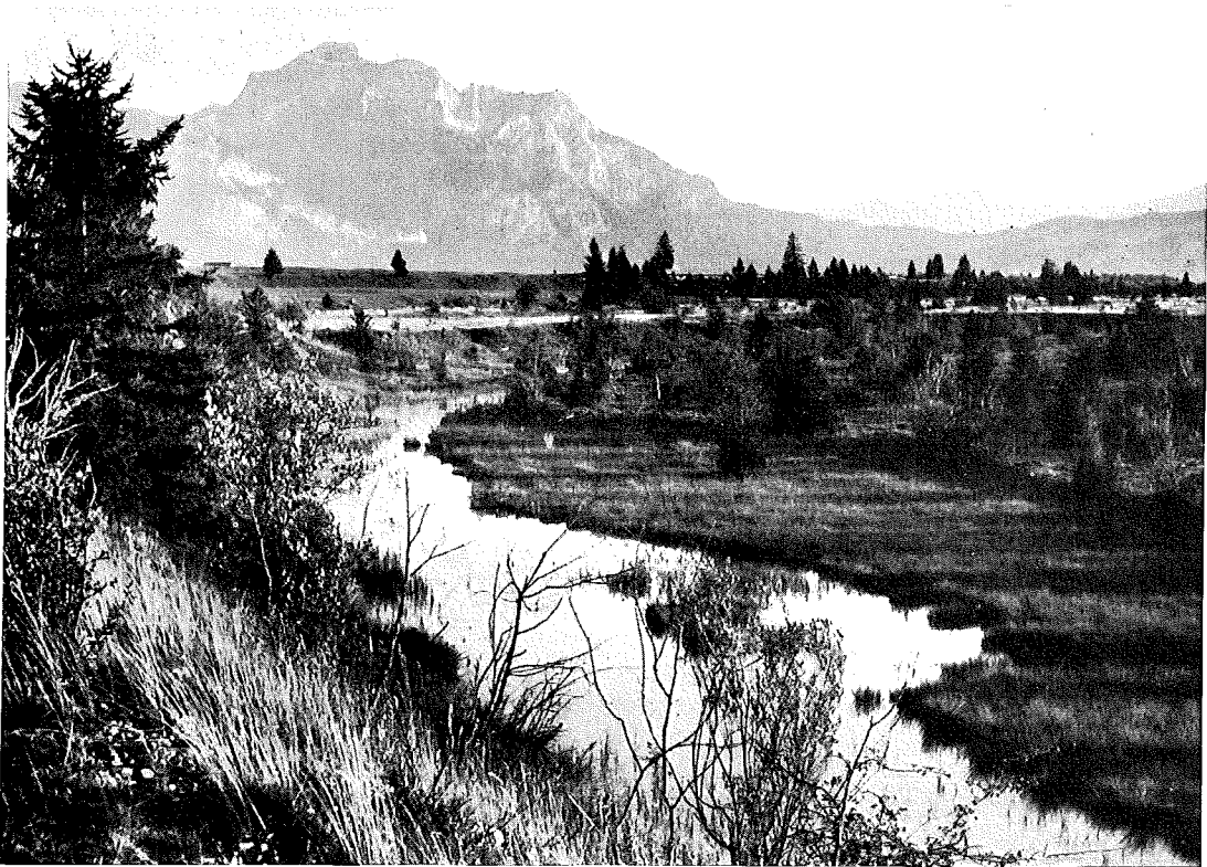
Lech-Altwasser bei Deutenhausen