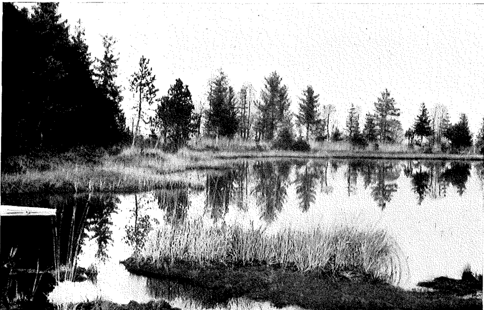
Abb. 4. Verlandungsrestsee EF mit zerklüftetem Schwingrasenufer. In unmittelbarer Nähe des Bildvordergrundes liegen, eingesenkt in eine rote Sphagnum -Schlenken-Gesellschaft, die Fundorte E und F.