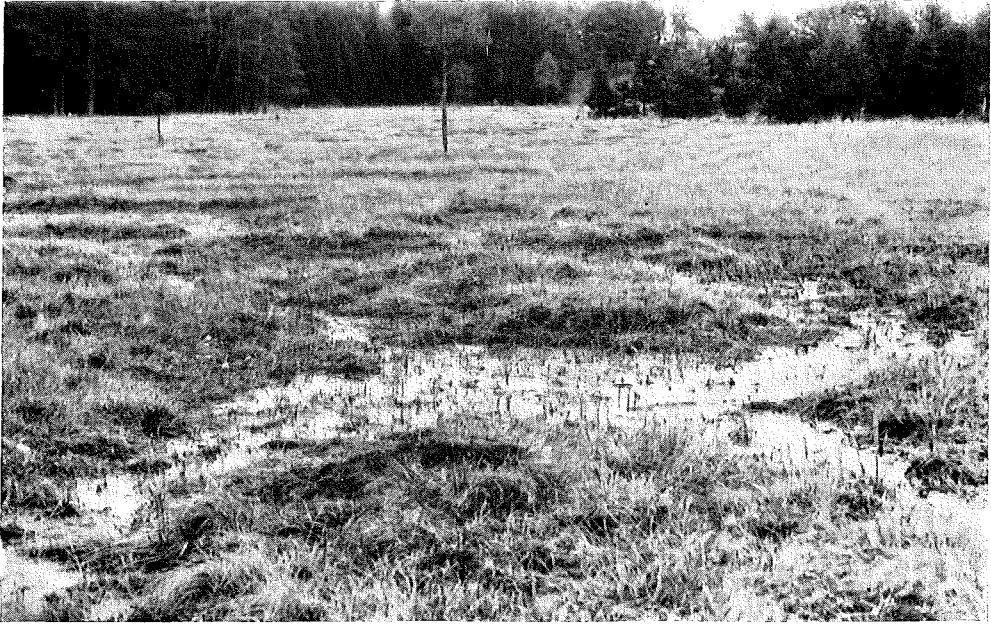
Abb. 3. Eine besonders gut ausgebildete, von großen Sphagnetum-Inseln umschlossene Schlenke (A), vorwiegend im Frühjahr häufig mit reinem, dickflüssigem Desmidiaceenschlamm angefüllt.