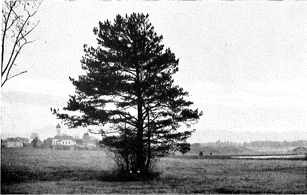
Abb. 1. Typisches Landschaftsbild für die Umgebung der Osterseen. Im Mittelgrund links die Ortschaft Ifeldorf, rechts der Sengsee.