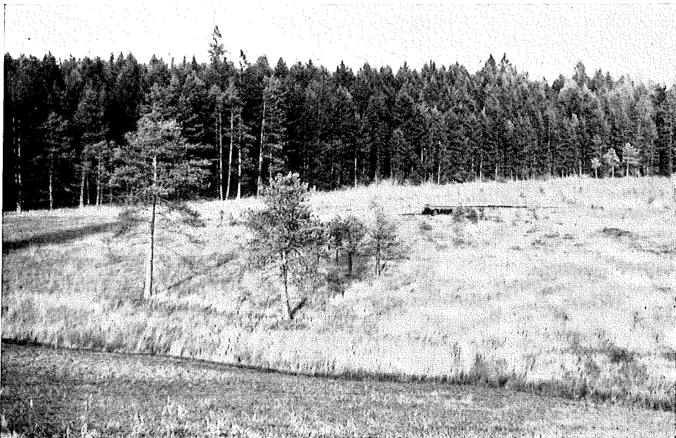
Abb. 2. Verlandete Bucht des Sengsees, von einem ganzen System zahlreicher verzweigter S-hlenken durchzogen, darunter S-hlenke B. Im Vordergrund abschüssiges, trockenes Wiesengelände, in der Mitte der Restsee B.