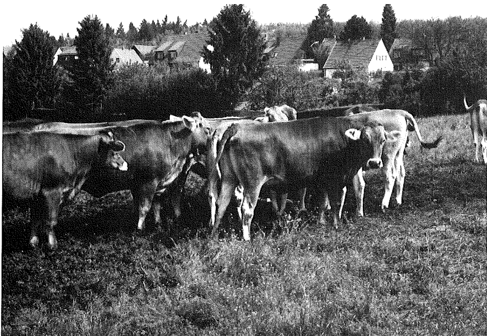
(3) Der Weideauftrieb der Rinder beendet die Entwicklung der Gesellschaft (Juni 1987).

Derzeit wird dieses sog. „Schafhofgelände“ von Anfang Mai bis Anfang November als Standweide für Grauvieh-Färsen von der TU-Versuchsstation „Veitshof“ genutzt.