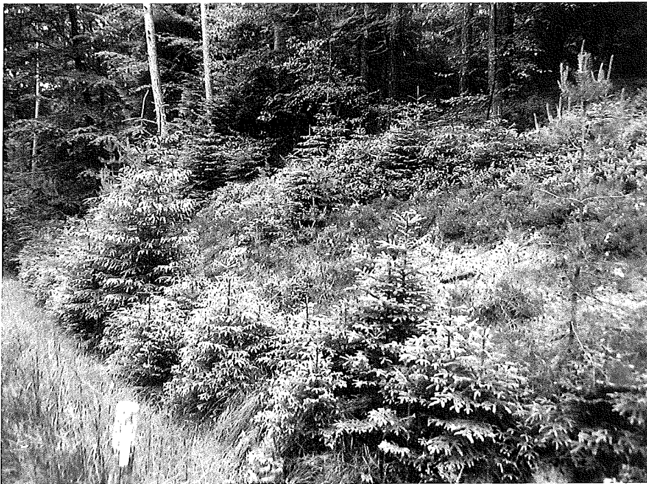
Abb. 1: Wuchsort von Diphasiastrum alpinum mit lückiger Heide-Vegetation und Vorwaldstadien an einer Forststraßenböschung bei Unterölsbach.

Bei dem neu entdeckten Wuchsort von D. alpinum im Landkreis Neumarkt i. d. Opf. handelt es sich um eine nordwestexponierte Forststraßenböschung in einer Höhenlage von 432 m ü. NN mit lückiger Heide-Vegetation und Vorwaldstadien (Abb. 1), welche neben Kennarten der Calluno-Ulicetea und Vaccinio-Piceetea (u. a. Huperzia selago ) eine Reihe von Magerkeitszeigern, Azidophyten, Wechselfeuchtezeigern ( Molinia caerulea ) sowie montane Elemente