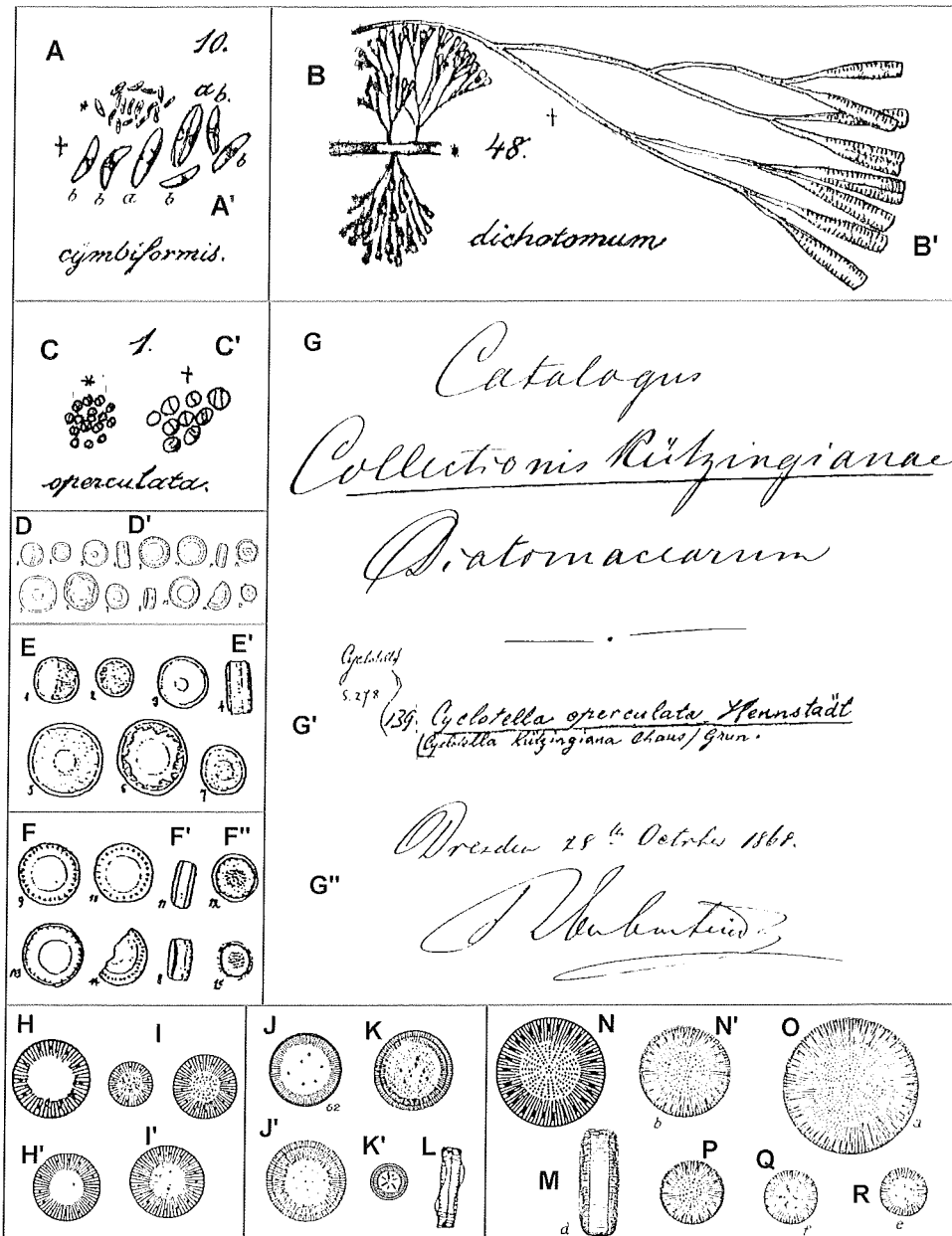
Abb. 1: Zeichnungen von Kützings gesammelten Kieselalgen. (A-C' aus KÜTZING 1833 und D-F'' aus KÜTZING 1844, mit G-G', Katalog seiner Sammlung) und Hustedt's Abbildungen von Cyclotella operculata (H-I'), C. kützingiana (J-L) und C. comta (M-R). Frustulia cymbiformis (A, direkt vom Mikroskop abgezeichnet; A', vergrößerte Formen), Frustulia dichotomum (B, direkt abgezeichnet; B', vergrößerte Form), Cyclotella operculata (D-D' aus KÜTZING 1844, E-E' unbehandelte und F-F'' behandelte Formen), drei Cyclotella Arten aus Hustedt's Publikationen (L in 1907, andere in 1930a, b; H' = C. operculata var. unipunctata , K = C. kützingiana var. planetophora , K' = C. kützingiana var. radiosa , Q-R = C. comta var. oligactis ).