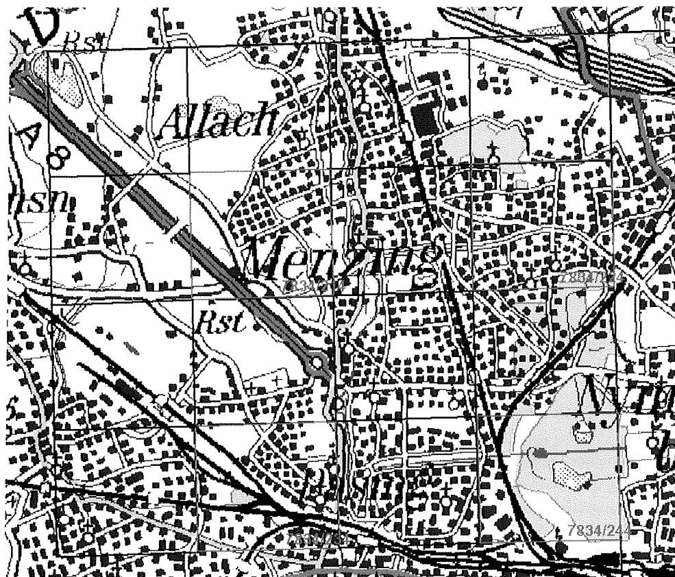
Karte 1: Übersicht der Kartierflächen in 7834/2

und Tolpis (Chlorocrepis) staticifolia . Fast nicht unterbrochen scheint sie bisher nur bei Gypsophila repens . Hat vielleicht auch hier ein Wechsel stattgefunden und sind heute andere Arten an das Isartal gebunden?