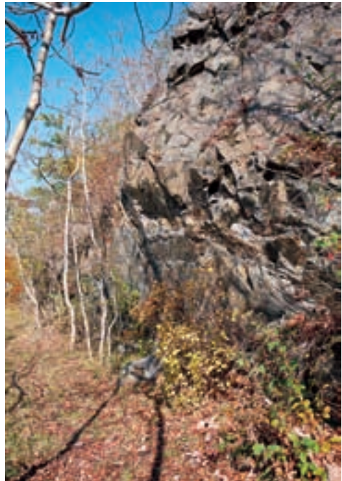
Abb. 2: Diabasfelsen an der Gallenleite bei Bad Lobenstein. Sie zeichnen sich durch Scapania aequiloba , Preissia quadrata , Plagiopus oederianus und Distichium capillaceum aus.

Die Vegetation ist stark anthropogen überformt. Innerhalb der Wälder herrschen einförmige Fichtenforste vor. Sie zeichnen sich nur am Sieglitzberg durch eine reichere Mooschicht