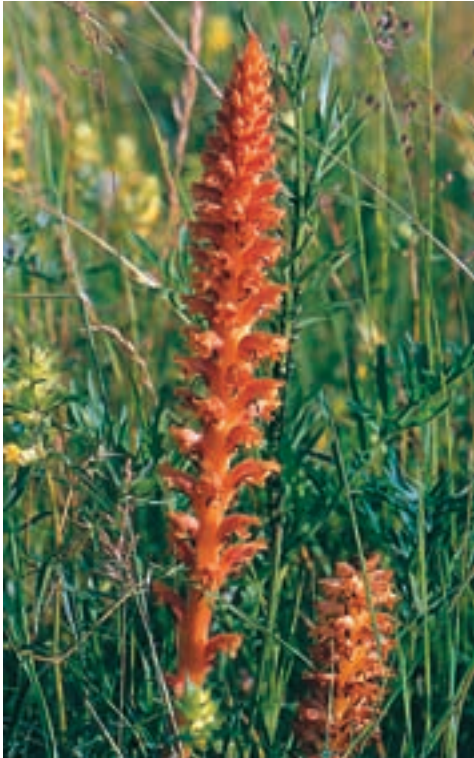
Abb. 1: Orobanche elatior bei Perchting, Starnberg, mit Wirt Centaurea scabiosa .