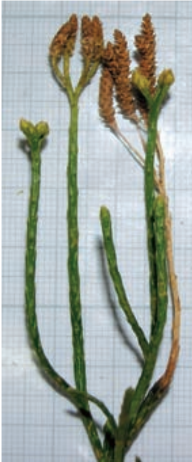
Diphasiastrum zeilleri mit Sommer- und Winterähren, Hochebene von Olkusz, 29.12.2008.