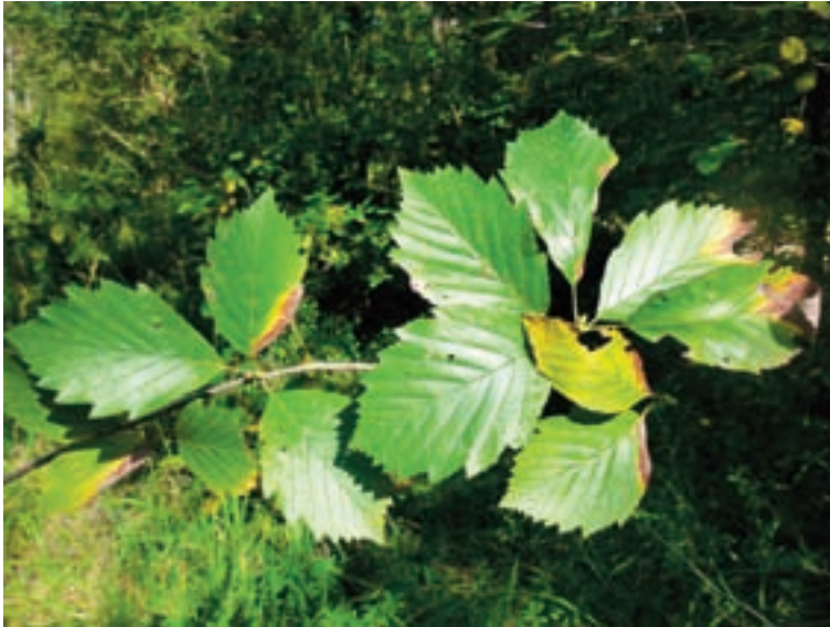
Kurz- und Langtrieb von Sorbus badensis am Fundort Heppenstein.