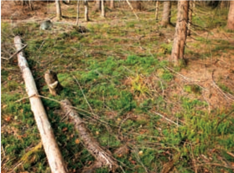
Abb.1: Teilansicht des neu entdeckten Bestandes von Diphasiastrum issleri im Bereich Schachtenhaus in einem lichten Fichten-Bestand.