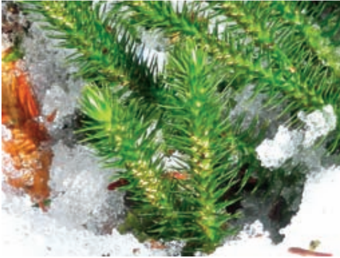
Huperzia selago im Reichholzrieder Moos, 9.3.2013.