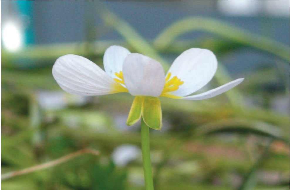
Abb. 4: Ranunculus peltatus/penicillatus aus dem Gengenbacher Mühlbach (TK 7514/3), 11.6.2015