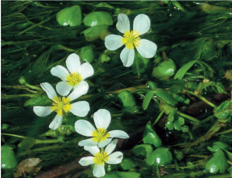
Abb. 2: Ranunculus peltatus/penicillatus im Biberacher Dorfbach (TK 7614/3), 11.6.2016