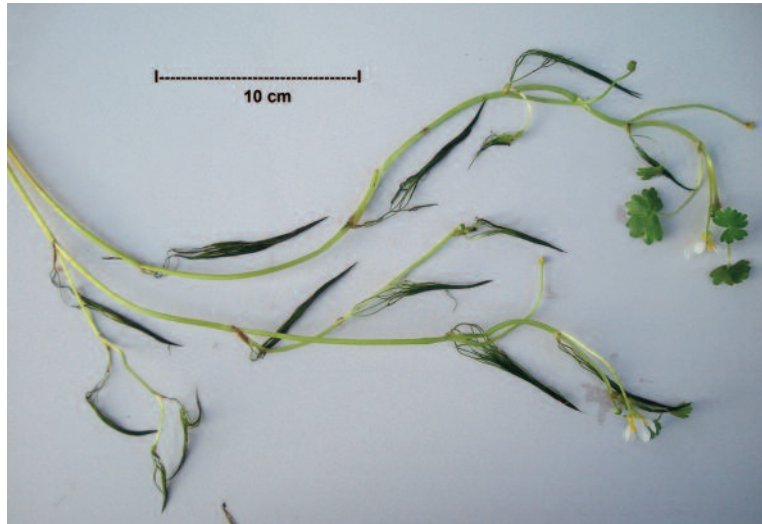
Abb. 3: Ranunculus peltatus/ penicillatus aus dem Gengenbacher Mühl- bach (TK 7514/3), 11.6.2015