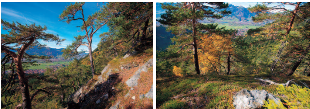
Abb. 3: Impressionen der lichten Fels-Kiefernwälder südlich der Grünten-Stuhlwand.

Im benachbarten, subozeanisch getönten Vorarlberg existieren keine vergleichbaren Bestände, was u.U. an dem dort schwächeren Föhnneinfluss liegen könnte (AMANN et al. 2014). Die nächstgelegenen, ähnlich aufgebauten und ausgestatteten Silikat-Kiefernwälder findet man erst in zentralalpinen, föhnbeeinflussten Tiroler Tälern wie Ötz-, Pitz- und Kaunertal, wo sie aber im Gegensatz zu den hier Vorliegenden nur schattseitig auftreten (Alois Simon, schriftl. Mitteilung vom 31.03.2016). Dieser Unterschied lässt sich mit den höheren Niederschlägen und dem subatlantisch getönten Klima der bayerischen Randalpen erklären, das subalpin verbreiteten Arten das Wachstum auf südexponierten Sonnenhängen ermöglicht. Ein weitergehender soziologischer und ökologischer Vergleich zwischen Rand- und Innenalpen wäre lohnend.