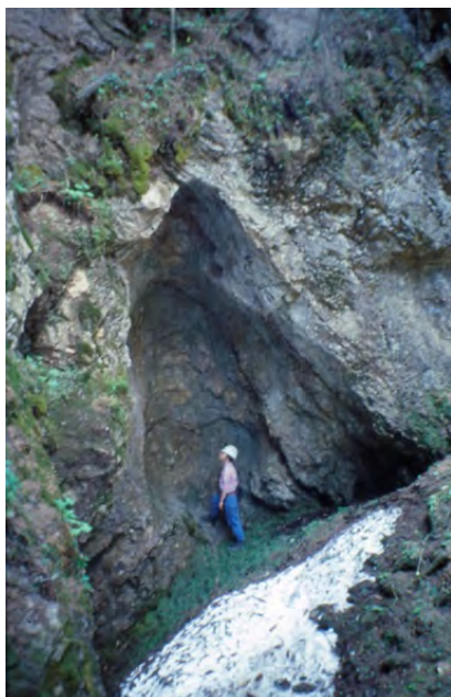
Fig. 6: Besonders schöne Feuersetzung im Tagbau oberhalb der Laimingalm, Gemeinde Itter.