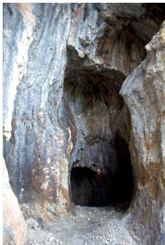
Fig. 5: Mooschrofen („Bürgl“) auf Zimmermoos oberhalb Brixlegg: Mustergültige, durch entsprechendes Fundgut datierte prähistorische Feuersetzungen (Ausschnitt).