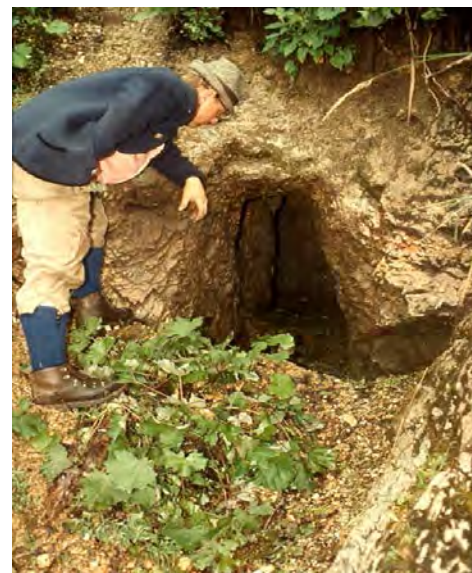
Fig. 2: Mundloch des 1963 vom Autor gewältigten Ivanusstollen, Bergbau Schwaz-Ringenwechsel, Revier Burgstall. Die prähistorischen Keramikfragmente fanden sich direkt auf dem anstehenden Schwazer Dolomit. Der vor geschichtlich betriebene Abbau lag etwa 10 m oberhalb.