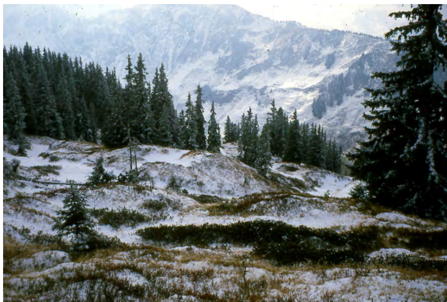
Fig. 7: Durch den prähistorischen Bergbau geprägte, typische Landschaft des Bergbaues Kelchalm, Gemeinde Aurach bei Kitzbühel.