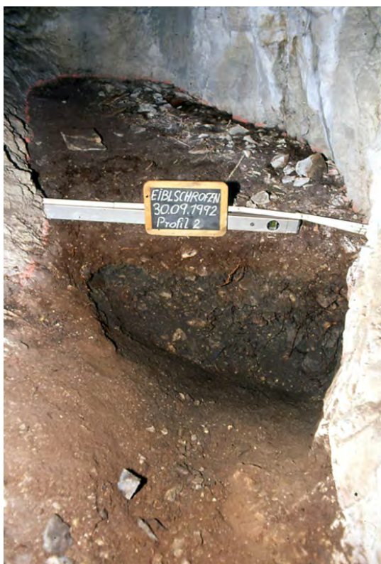
Fig. 4: Grabung 1992 in der „Geophonkaverne“ am Eiblschrofen. Im Profil untere 2/3 Reste der datierbar gewesenen Feuersetzung, darüber (braun) jüngere Sedimente.