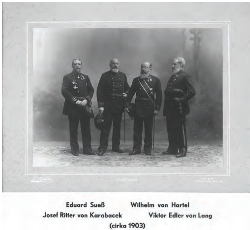
Abb. 8. Präsidium der kaiserlichen Akademie der Wissenschaften um 1903.

Eduard Suess, der sicherlich zu den bedeutendsten Präsidenten der kaiserlichen Akademie der Wissenschaften in Wien zählte, verglich die Wirksamkeit „seiner“ Akademie gerne mit weithin herrschenden Strömungen der Meerestiefe, die unabhängig von der veränderlichen Richtung der Stürme der Oberfläche in Ruhe ihre vorgeschriebenen Straßen verfolge, und so werde auch die Akademie von einer tiefen Strömung getragen, die „unausgesetzt die entfernteren Zielpunkte aufweist und einen edlen Ehrgeiz zu erwecken bemüht ist.“