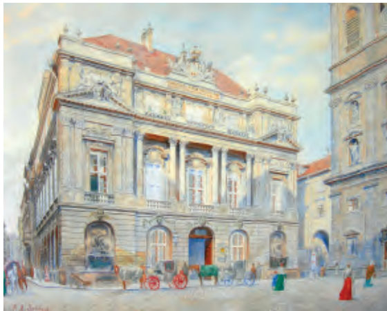
Abb. 1. Hauptgebäude der kaiserlichen Akademie der Wissenschaften (ÖAW) in Wien im 19. Jahrhundert (Archiv ÖAW).

„Es ist wohl nicht zu viel behauptet, wenn man sagt, daß an allen bedeutenderen naturwissenschaftlichen Untersuchungen, die in den letzten Dezennien in Österreich zur Ausführung gelangten, Eduard Suess als Anreger oder Mithelfer oder Ratgeber beteiligt war. Die Kräfte der Kaiserlichen Akademie in diesem Sinne zu leiten und zu lenken, lag ihm vor allem am Herzen.“, schreibt der Mineraloge Friedrich Becke (1855–1931) in seinem Nachruf im Almanach der kaiserlichen Akademie der Wissenschaften 1914 über seinen Lehrer Eduard Suess (1831–1914) und bringt damit dessen Bestrebungen zur Verbreitung von Wissenschaft und Bildung auch in weiten Kreisen des Volkes sowie die Vielseitigkeit und Schaffenskraft von Suess auf den Punkt.