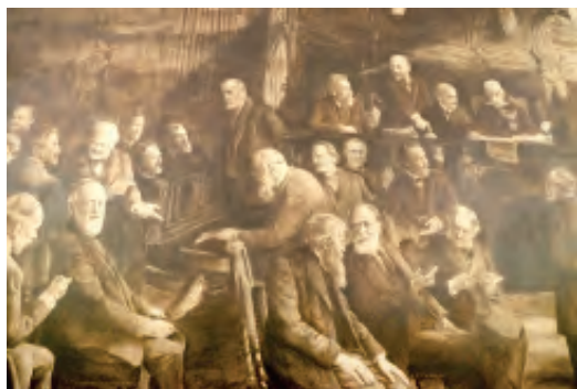
Abb. 3. Eduard Suess (stehend im Hintergrund) während einer Akademiesitzung. Gemälde von Olga Prager, 1912 (Archiv ÖAW).

Ein wesentliches Ziel, das Suess daher verfolgte, war die Internationalisierung des wissenschaftlichen Lebens über die Grenzen der eigenen Forschungsinstitutionen hinaus. Auf diese Weise wurden Wissenschaftler und wissenschaftliche Leistungen aus verschiedenen Ländern zu effizienten Forschungsgemeinschaften zusammengeführt oder zumindest zum Wissenstransfer