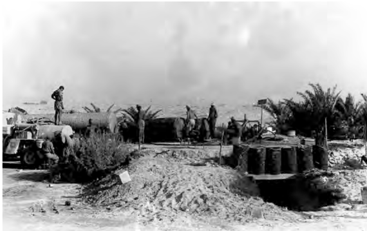
Abb. 3: Wasserstellenbau bei Bagush-Burbeita (9.7.1941)

Der offizielle Tätigkeitsbericht der (personell aufgestockten) Wehrgeologenstelle 12 für die 2. Augushälfte (15.-31.8.1941; Nr. 1366 geh.), abgeschlossen am 2. September 1941, beinhaltete: