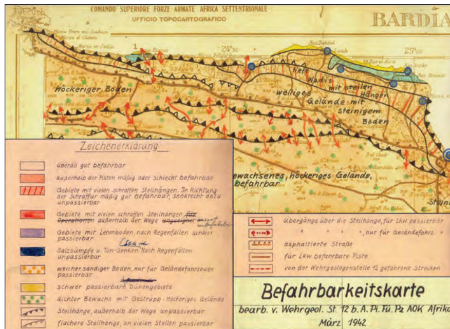
Abb. 5: Ausschnitt der von der Wehrgeologenstelle 12 für die Panzerarmee Afrika entwickelten Gelände-Befahrbarkeitskarte, Blatt Bardia 1:400.000, März 1942.