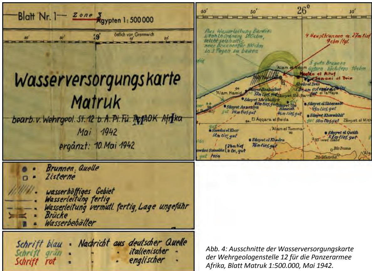
Abb. 4: Ausschnitte der Wasserversorgungskarte der Wehrgeologenstelle 12 für die Panzerarmee Afrika, Blatt Matruk 1:500.000, Mai 1942.

Einzigster Verlust der Wehrgeologenstelle 12 an Menschenleben blieb im November 1942 auf dem Rückzug nach der Schlacht um el Alamein der Tod des Geologen Feldwebel Dr. Rudolf SÖFNER bei Sollum.