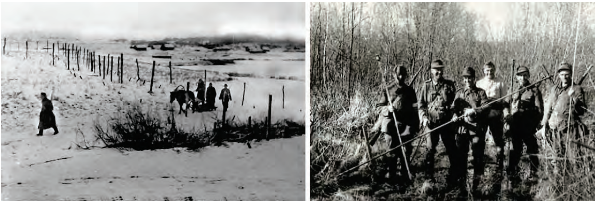
Abb. 6: Links: Geologischer Bohrtrupp bei Alexejewa am Popowa-See (12.12.1943). Rechts: Moorkartierung mit dem Peilstangengerät im Raum östlich von Ssebesh (April 1944).

Ein wesentliches Kriterium zur Beurteilung der Tragfähigkeit von Mooren bildete die Torfmächtigkeit und diese wurde im Krieg mittels Peilstangengerät abgebohrt. Abbildung 6 zeigt unten einen Bohrtrupp in einem Moor östlich von Ssebesh, dass trotz des sehr weichen Untergrundes noch deshalb begehbar ist, da das dichte Wurzelgewebe der lebenden Pflanzen die oberste Torfschicht verstärkt. Ein solcher zäher, lebender Wurzelteppich konnte nicht nur auf weichem Moor, sondern auch auf Wasser schwimmen und trotzdem unter Umständen stark genug sein, um Truppen oder sogar leichtere Panzer zu tragen. In solchen Fällen würde es genügen, den Zusammenhalt dieser obersten Schicht, nämlich der lebenden Wurzelzone zu zerstören, um eine außerordentlich starke Sperrwirkung zu erzielen. Mittels Peilstangengerät konnte in Mooregebieten flächendeckend die Torfmächtigkeit und in den Bohrlöchern nach drei Tagen die Höhe des Grundwasserspiegels (unter Geländeoberkante aufgespiegelt) ermittelt werden.