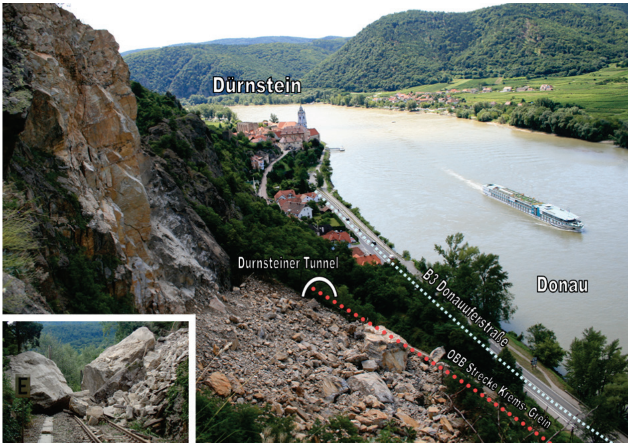
Abbildung 1: Übersicht Felssturz Dürnstein/ Wachau, Niederösterreich, Blickrichtung Süden.

In der Biratalwand kam es am 7. Juli 2009 kurz nach 21:00 Uhr im Zuge starker Regenfälle zu einem Felssturz, bei dem die Gleisanlage der Donauuferbahn (im Jahr 2009 betrieben von den ÖBB, heute NÖVOG) auf einer Länge von ca. 30 m von bis zu mehrere Zehnerkubikmeter großen Blöcken verschüttet wurde. Die Gleisanlage wurde in diesem Abschnitt völlig zerstört. Das Gesamtvolumen des Felssturzes wurde mit mindestens 11.000 m 3 ermittelt, der größte Einzelblock wies ein Volumen von rd. 1.000 m 3 auf. Einzelne, kleinere Steine stürzten bis auf die zwischen Eisenbahnlinie und Donau gelegene Landesstraße B3 und den unterhalb der Bahnlinie verlaufenden Radweg (Abb. 1).