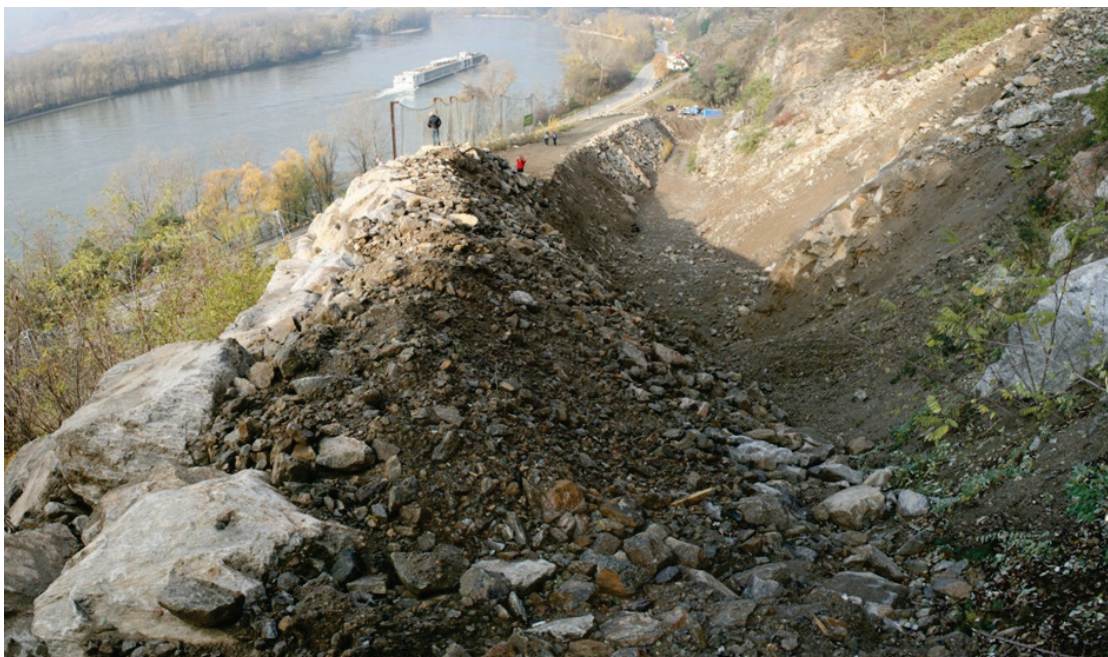
Abbildung 5: Retentionsraum hinter dem Schutzdamm nach erfolgter Ausräumung, Blickrichtung Norden.