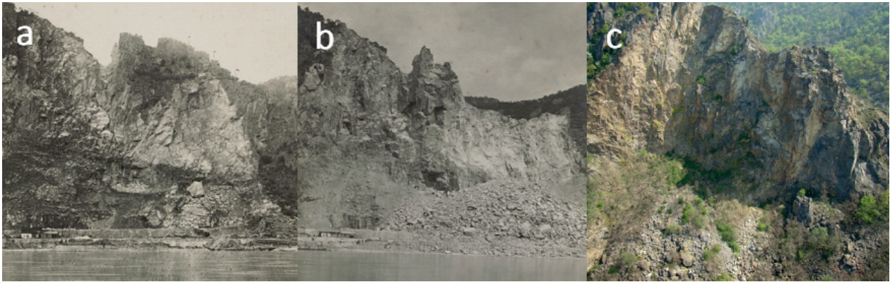
Abbildung 2: Zustand der Felswand vor (a) und nach (b) der Sprengung vom 4. Mai 1909, bzw. vor dem Felssturz 2009 (c), Blickrichtung von der Donau Richtung Osten.