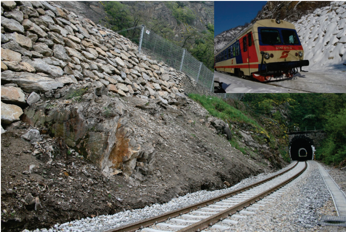
Abbildung 3: Wiederinbetriebnahme der Bahnstrecke Ende 2009.

Die Ergebnisse des Monitorings zeigten nach einer Beobachtungsdauer von etwa einem Jahr sehr deutlich, dass immer wieder, speziell im Zusammenhang mit Starkregenereignissen, Verschiebungen in der Felswand auftraten, die zur langfristigen Sanierung einen weiteren, kontrollierten Abtrag von instabilen Teilen der Felswand bis auf eine stabile Endgeometrie erforderte (Abb. 4).