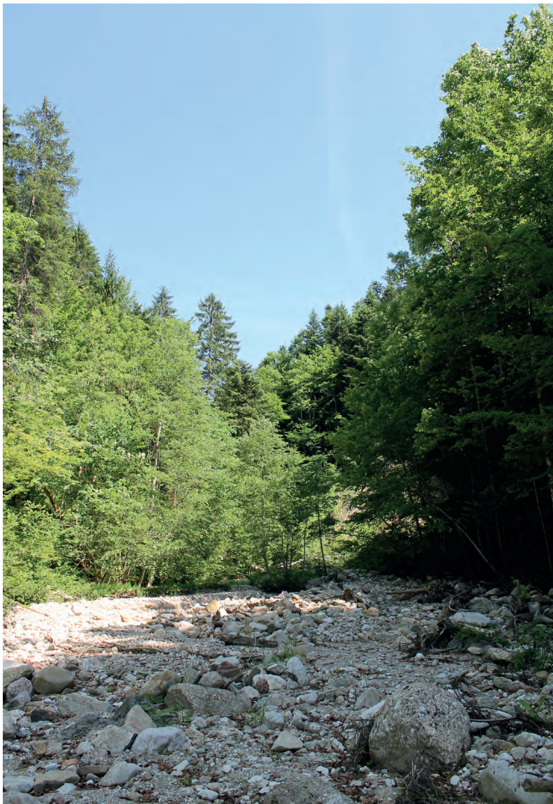
Abb. 3: Fundstelle des Stoßzahnfragmentes des Wollhaarmammuts ( Mammuthus primigenius ) im Bachbett des Zwieselbachgrabens.

grub-Stand, wurden nochmals weite Bereiche des Abtenauer Beckens mit Eismassen bedeckt. Der dem Schwarzberg-Stand angehörende mächtige Moränenwall im Südosten des Abtenauer Beckens zeigt an, dass im Gschnitz-Stadial (16.000 BP, IVY-OCHS et al., 2006) nochmals einzelne Gletscherzungen vom Plateau des Tennengebirges bis in das Abtenauer Becken hinabreichten (KALS, 1984). Im ausgehenden Spätglazial und Holozän formten sich schließlich durch fluviatile Zerschneidung der mächtigen Grundmoränendecke sowie Tiefenerosion im unterlagernden Grundgestein tief eingeschnittene Gräben, wie unter anderem auch der Zwieselbachgraben (Abb. 2-3), worin der hier untersuchte Fossilrest entdeckt wurde.