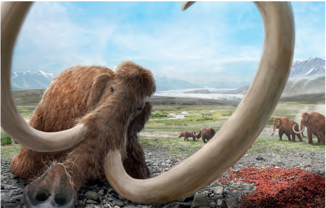
Abb. 5: Wollhaarmammut ( Mammuthus primigenius ) vor einer jungpleistozänen inneralpinen Beckenlandschaft.

Fig. 5: Woolly mammoth ( Mammuthus primigenius ) in front of an Upper Pleistocene inneralpine basin landscape.