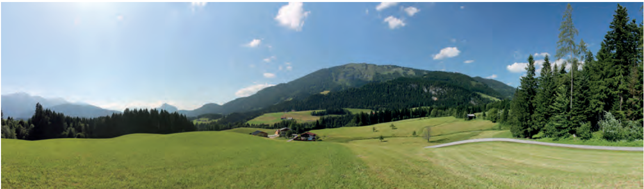
Abb. 2: Panorama über die Hügellandschaft an den Ausläufern des Radochsberges oberhalb des Zwieselbachgrabens mit dem Tennengebirge (links) und der Osterhorngruppe (rechts) im Hintergrund.

Während der präquartäre Untergrund des Abtenauer Beckens aus Haselgebirge, Dolomit sowie triassischem Schiefergestein der Werfen-Formation aufgebaut ist, wird die rezente, flach-hügelige Geländemorphologie des Abtenauer Beckens maßgeblich durch glaziale Ablagerungen des Jungpleistozäns geprägt: Vor der letzten Maximalvereisung (29.000-19.000 BP, STARNBERGER et al., 2011) kam es ab dem Beginn des Spätwürm (um 34.000 BP) in den Hochlagen aufgrund eines klimatisch indizierten Vegetationsrückganges sowie verstärkter Frostverwitterung zu einer vermehrten Schuttbildung, infolgedessen in den Tallagen eine massive Ablagerung so genannter „Vorstoßschotter“ (VAN HUSEN & REITNER, 2011) erfolgte, wodurch das anstehende Grundgestein im Abtenauer Becken mit bis zu 40 m mächtigen fluviatilen Schottern überdeckt wurde. Typisch für derartige Vorstoßschotter ist eine Zusammensetzung aus primär autochthonen Gesteinen sowie unregelmäßige Lagerungsverhältnisse, welche rasch wechselnde Sedimentationsprozesse im Gletschervorfeld anzeigen (VAN HUSEN, 1979, KALS, 1984; persön. Mitteilung VAN HUSEN).