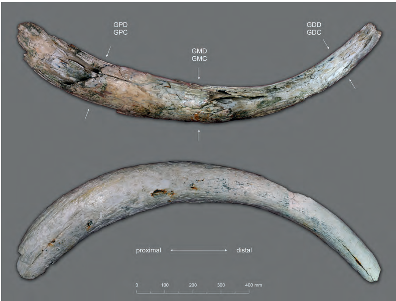
Abb. 4: Stoßzahnfragment des Wollhaarmammut ( Mammuthus primigenius ) aus dem Zwieselbachgraben in medialer (oben) und lateraler (unten) Ansicht mit der Position der osteometrischen Messstrecken. Abkürzungen: GPD/GPC = größter proximaler Durchmesser und Umfang, GMD/GMC = größter medialer Durchmesser und Umfang, GDD/GDC = größter distaler Durchmesser und Umfang.

Fig. 4: Tusk fragment of woolly mammoth ( Mammuthus primigenius ) from the Zwieselbachgraben in medial (above) and lateral (below) view with the position of osteometric measurements. Abbreviations: GPD/GPC = greatest proximal diameter and circumference, GMD/GMC = greatest medial diameter and circumference, GDD/GDC = greatest distal diameter and circumference.