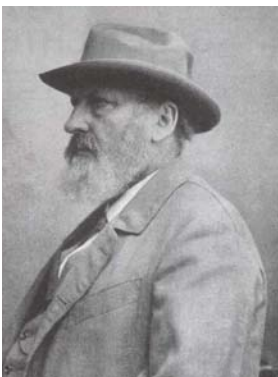
Eduard Sueß (1831-1914)

Am Anfang seiner tektonischen Studien kümmerte sich Sueß kaum um diese Diskrepanz, weil von den Abschiebungen beherrschte Einbruchsgebiete durch die radiale, d. h. vertikale Komponente der Schrumpfung ohne weiteres erklärbar erschienen. Alle diese Einbruchsgebiete, die Sueß damals vorschwebten, besaßen aber mehr oder minder isometrische oder nur wenig gestreckte Planformen wie Ozeane und Kesselbrüche. Selbst wenn Sueß von „Senkungslinien“ sprach, bezeichnete er sie als „gemeinschaftlich die Lage eines Senkungsfeldes“ zeichnend ( Das Antlitz der Erde , Bd. Ia, S. 165). Der Rheingraben, den er die „große Grabenverwerfung des Rheins“ nannte ( Antlitz der Erde , Ib, S. 392) war ihm bekannt, ebenso die Deutung als von Abschiebungen begrenzter Gesteinskeil durch Élie de Beaumont (1798-1874). Sueß zitierte Élie de Beaumont und schien seine Deutung zu loben, aber auf derselben Seite machte er, ohne es deutlich zu sagen, klar, dass für ihn der Rheingraben nichts anderes als ein Senkungsfeld, verursacht durch radiale Brüche, war ( Antlitz der