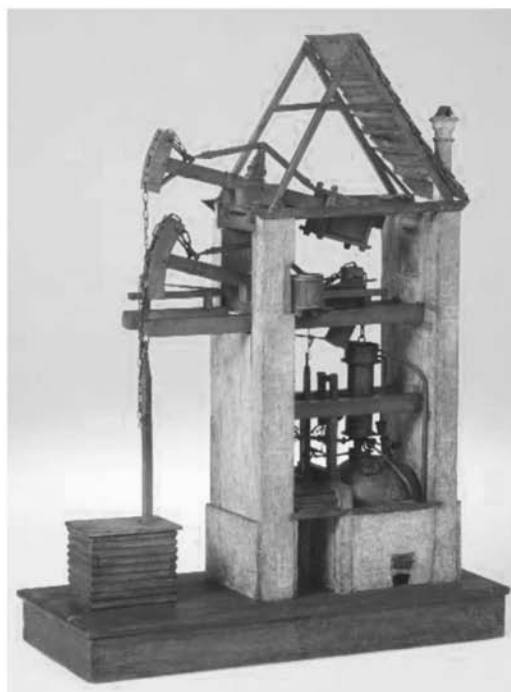
Abb. 2: Oben: Emanuel Fischer von Erlach in zeitgenössischen Porträts (aus: Zacharias). Links anonym, rechts Bertrand. Unten: Modell der mit Dampf betriebenen Wasserpumpe nach Thomas Newcomen im Technischen Museum