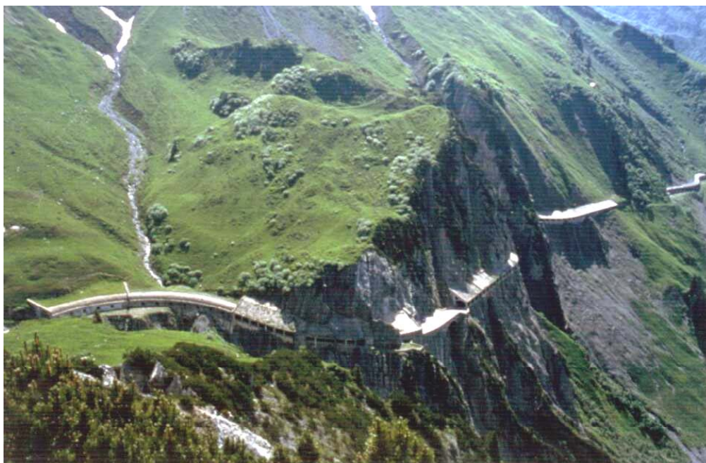
Abb. 3 Flexenstrasse (1897), Bauzustand 1999

Die Bau- bzw. Generalunternehmerverträge aus der Zeit des frühen Eisenbahnbaus ermöglichen interessante Vergleiche zu aktuellen Vertragsfragen und Vertragsmodellen. Beispielhaft ist der Umgang mit dem Baugrundrisiko und die Rolle der Geologie am Lötschbergtunnel in der Schweiz anlässlich des Verbruchs unter dem Gasterntal im Jahre 1908, wo die Verantwortungsfrage bereits gerichtlich geklärt wurde (ROTHPLETZ 1944)