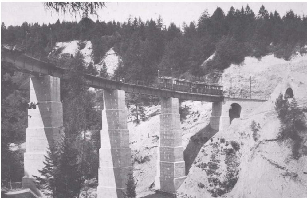
Abb. 2 Stubaitalbahn (1904), Mutterer Brücke (aus: BAUMGARTNER 1990)

Die „Pionierzeit der Ingenieurgeologie“ zeigt erstaunliche Parallelen zur Projektgegenwart (POSCHER 2004), was an zwei Beispielen verdeutlicht werden soll: