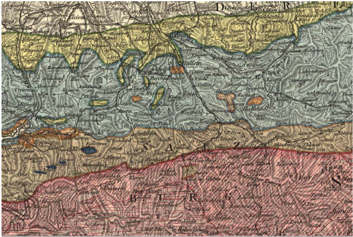
Abb. 1 / Fig. 1