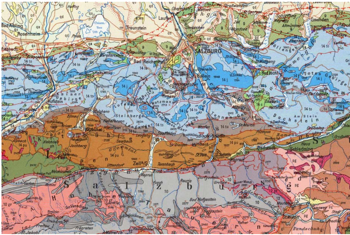
Abb. 2 / Fig. 2