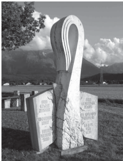
Abb. 1: Denkmal am Walser Feld, Blickrichtung SSW, im Hintergrund Mitte Untersberg, rechts Predigtstuhl.

Der Text soll eine Botschaft sein: Die Schlacht ist Vergangenheit. Die Gegenwart soll aus Fehlern der Geschichte lernen, um diese in Zukunft nicht zu wiederholen.“