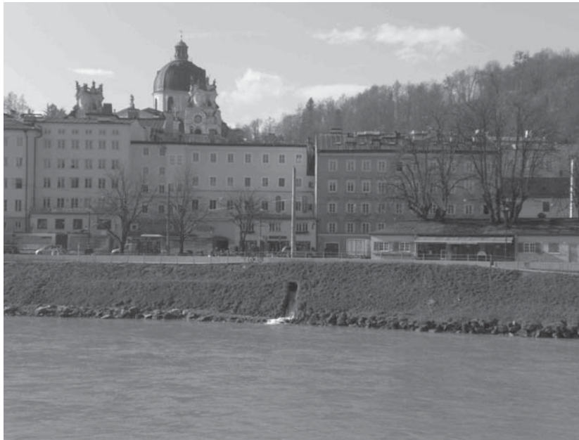
Abb. 3: Salzach (Normalwasserstand) zwischen Staatsbrücke und Makartsteg. Fließrichtung nach rechts. Blick zur linksufrigen Altstadt. Die Einmündung des Gamperarmes ist nur bei Hochwässern unsichtbar. Hintergrund rechts Kollegienkirche.

Als Folgen der Sohlerosion wurden in der Stadt Salzburg Uferböschungen destabilisiert, Brückenfundamente (Eisenbahnbrücke, Salzachbrücke der Westautobahn A 1) unterspült und das Grundwasserspiegelgefälle zu den Vorflutern Salzach und Saalach erhöht. Mit dem beschleunigten Grundwasserstrom wurden Feinsandanteile aus weitgestuften Korngemischen ausgewaschen, was Bauwerkssetzungen und Geländeabsenkungen zur Folge hatte. Auch der Unterlauf der Salzach befindet sich im morphologischen Ungleichgewicht (Defizit in der Geschiebeführung und sukzessive Eintiefung der Sohle). Nach dem Einsturz der Salzachbrücke der Westautobahn A 1 im August 1959 (Abb. 4) wurden bei den meisten Brücken im Stadtgebiet Sanierungs- und Verstärkungsmaßnahmen an den Pfeilern vorgenommen (WEIDENHOLZER & MÜLLER, 2001), z.B. massive Steinschüttungen an der Eisenbahnbrücke. Weiters wurde unter Ausnützung einer linksufrig oberflächennahen Felsschwelle im Flysch etwa 500 m stromaufwärts der Glanmündung 1968 eine Sohlstufe errichtet (HEINRICH, 1968).