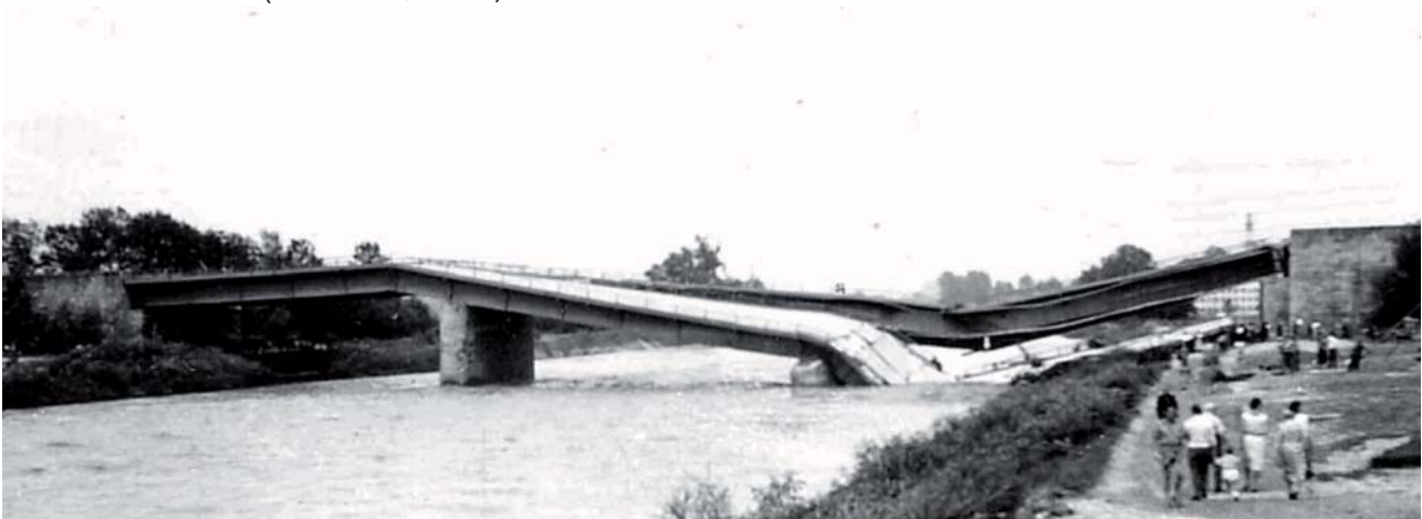
Abb. 4: Salzachbrücke der Westautobahn A 1 nahe Hagenau (Gemeinde Bergheim), beim Hochwasserereignis am 13. August 1959 infolge Unterspülung des östlichen Brückpfeilers (im Bild rechts) eingestürzt. Blickrichtung NNW.

Als Folgen der Sohlerosion wurden in der Stadt Salzburg Uferböschungen destabilisiert, Brückenfundamente (Eisenbahnbrücke, Salzachbrücke der Westautobahn A 1) unterspült und das Grundwasserspiegelgefälle zu den Vorflutern Salzach und Saalach erhöht. Mit dem beschleunigten Grundwasserstrom wurden Feinsandanteile aus weitgestuften Korngemischen ausgewaschen, was Bauwerkssetzungen und Geländeabsenkungen zur Folge hatte. Auch der Unterlauf der Salzach befindet sich im morphologischen Ungleichgewicht (Defizit in der Geschiebeführung und sukzessive Eintiefung der Sohle). Nach dem Einsturz der Salzachbrücke der Westautobahn A 1 im August 1959 (Abb. 4) wurden bei den meisten Brücken im Stadtgebiet Sanierungs- und Verstärkungsmaßnahmen an den Pfeilern vorgenommen (WEIDENHOLZER & MÜLLER, 2001), z.B. massive Steinschüttungen an der Eisenbahnbrücke. Weiters wurde unter Ausnützung einer linksufrig oberflächennahen Felsschwelle im Flysch etwa 500 m stromaufwärts der Glanmündung 1968 eine Sohlstufe errichtet (HEINRICH, 1968).