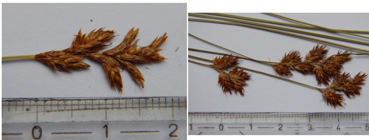
Abb. 2: Links der als Bogen-Segge bestimmte Beleg ( Carex curvata aff.) von einer mageren Straßen-Böschung NW von Strem-Dorf und rechts als Vergleich die Früh-Segge ( Carex praecox ) aus einer Überschwemmungswiese an der March bei Wutzelburg. / The herbarium record identified as Carex curvata from a nutrient poor road embankment northwest of Strem Village (left) and for comparison, the early-sedge ( Carex praecox ) from a flood meadow at the March near Wutzelburg (right).

tica , 209 m, 8964/1, 26.5.2012, leg. MS 4 . Nach einer neuerlichen Überprüfung des Beleges spricht aber vieles dafür den Beleg als C. praecox x brizoides anzusprechen, vor allem da fast nur sterile Schläuche zu finden sind. Die Schläuche sind nur rund 2,5 mm lang, aber fast von Grund auf geflügelt. Die einzelnen Blühtriebe tragen meist 6 Ährchen die teilweise gebogen, teilweise gerade sind. Ein zweiter, oben genannter Beleg aus dem Quadranten 8964/3 stellte sich bei genauerer Prüfung allerdings eher als C. curvata entsprechend heraus (Abb. 2). Bei diesem Beleg besitzen die Blühtriebe 5–7 deutlich gekrümmte Ährchen. Die Schläuche sind zwischen 3 und 3,25 mm lang und 1–1,2 mm breit. Die Flügelung setzt oberhalb der Mitte 1,5 mm über der Basis des Schlauches an. Die Pflanzen sind mit 40 cm auch vergleichsweise hochwüchsig. Die angeführten Merkmale liegen alle innerhalb der Schlüsselmerkmale für C. curvata in Fischer et al. (2008). Aufgrund arealgeographischer Gründe bedarf der Fund allerdings noch einer Revision durch einen Experten, da es sich um den Erstfund der Art für das Burgenland handeln würde (Niklfeld in litt.).