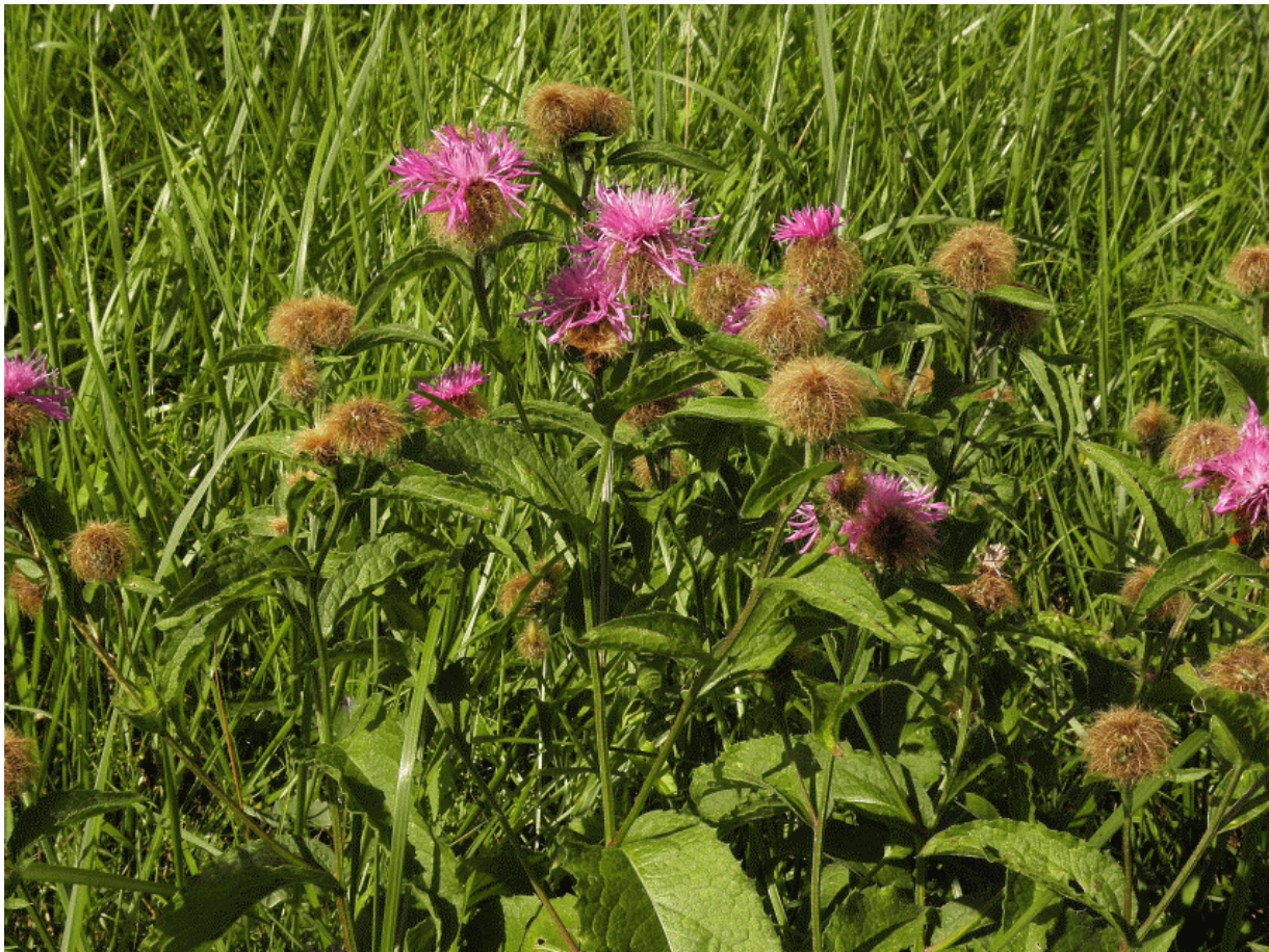
Abb. 3: Die Schmalschuppige Perücken-Flockenblume ( Centaurea stenolepis) in einer Glatthafer-Fettwiese am Lahmberg südlich der Strem-Niederung. / Wig knapweed ( Centaurea stenolepis) in a tall-oatgrass meadow at mount Lahmberg south of Strem-valley. 29.08.2011