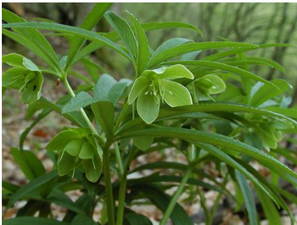
Abb. 5: Die im Bereich des Pinka-Durchbruchs häufige Hecken-Nieswurz ( Helleborus dumetorum). / The hedge-hellebore ( Helleborus dumetorum), a common species in the river Pinka ravine. 10.4.2009