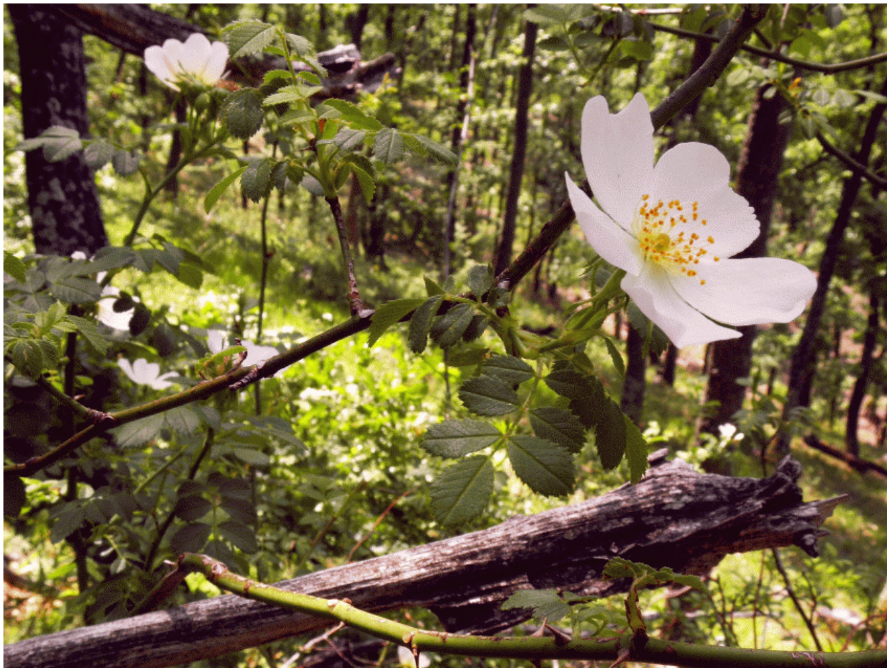
Abb. 8: Die Feld-Rose ( Rosa agrestis) in einem Zerreichenwald am Pinka-Durchbruch. / The field briar (Rosa agrestis) in a turkey-oak forest in the area of the river Pinka ravine. 26.5.2012