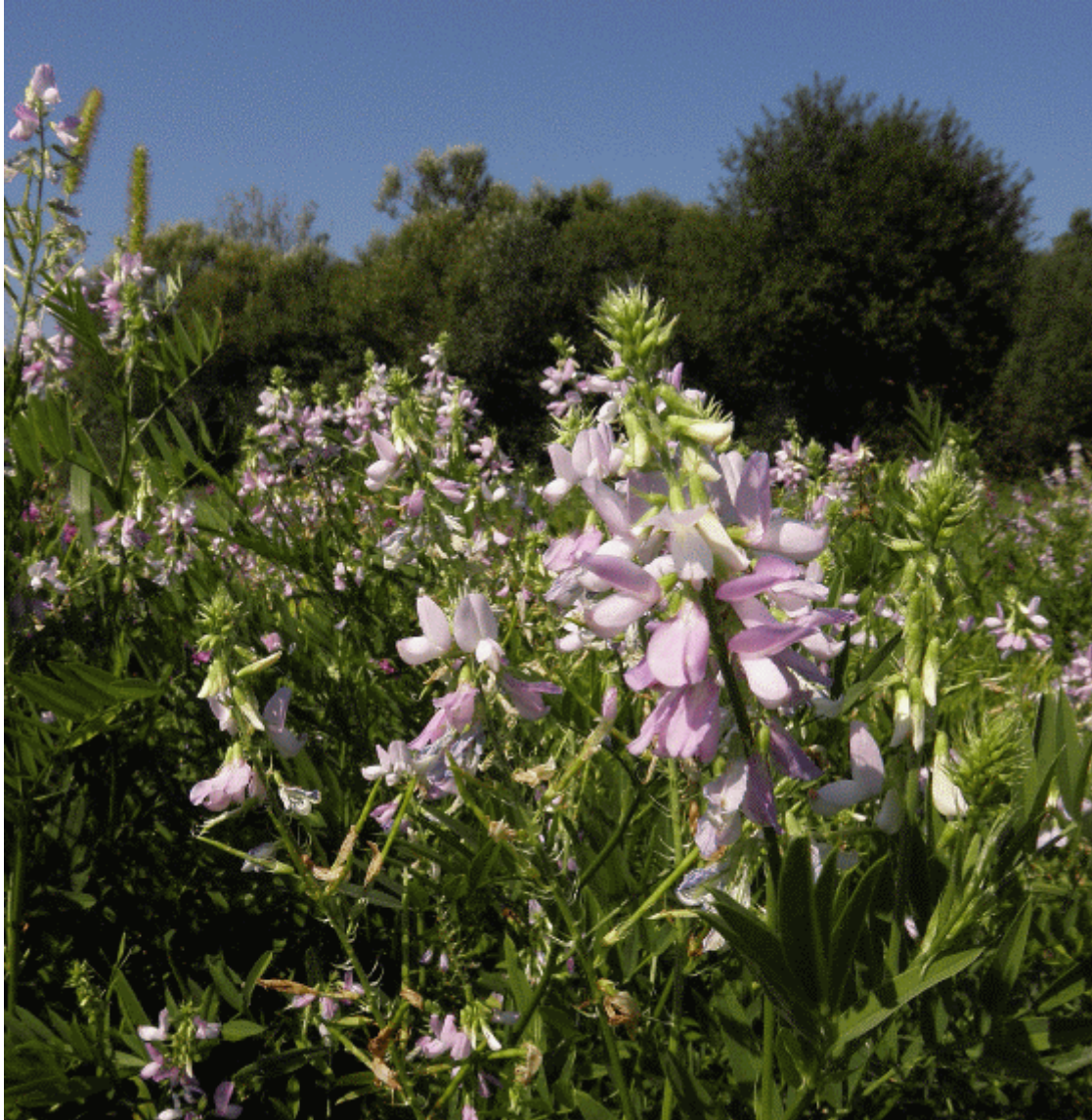
Abb. 4: Die submediterran verbreitete Geißraute ( Galega officinalis) im Stremtal bei Urbersdorf. / The mainly submediterranean distributed french lilac ( Galega officinalis) in the Strem-valley near Urbersdorf. 26.08.2011