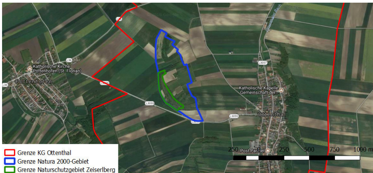
Abb. 2: Lage des Naturschutzgebietes „Zeiserlberg“ in Ottenthal. / Position of the nature reserve “Zeiserlberg” in Ottenthal.

In den 1990er-Jahren erfolgte erstmals eine genaue Charakterisierung des Standortes (Zinöcker 1996). Eine neuerliche Untersuchung im Jahr 2006 (Zinöcker 2006) ergab das Bild einer in diesem Zeitraum weitgehend unveränderten Artenkombination, die nach wie vor eine Ansprache als Phlomis tuberosa -Gesellschaft erlaubte. Demnach waren bei beiden Erhebungen Arten verschiedener Syntaxa (Geranion-sanguinei, Festuco-Brometea, Galio-Urticetea, Artemisietea) am Gesellschaftsaufbau beteiligt. Die saumartige Bestandesstruktur gemeinsam mit der Dominanz von Phlomis tuberosa erlaubt die Ansprache als xerophile Saumgesellschaft innerhalb des Geranion sanguinei (Zinöcker 2006).