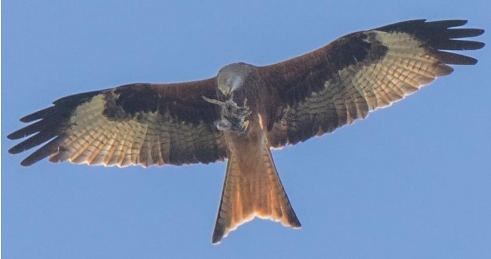
Abb. 7: Rotmilan mit Beute, vermutlich Schermaus, Weng bei Altheim, 22.10.2018, Kleinsäuger sind die überwiegend festgestellten Beutetiere des Rotmilans in Oberösterreich.