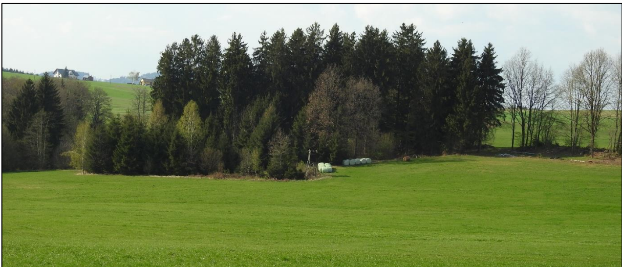
Abb. 2: typischer, kleiner Horstwald des Rotmilans, umgeben von Grünland (Mühlviertel), Horstbaum in einer Fichte am Waldrand; Foto: H. Rubenser

Zu Verlagerungen der Horststandorte in der Nähe des vorjährigen Nistplatzes kam es in zumindest drei Revieren (Salzachtal, Mattigtal Mitte und Nord). Als Horststandorte wurden entweder kleine Bauernwälder (ab 4 ha) oder die Randbereiche größerer Wälder bevorzugt, mit einer maximalen Entfernung des Horstes zum Waldrand von 75 m (Details in UHL & PFLEGER 2017). Bei Horsten innerhalb größerer Wälder, waren meist niedrige Schlagflächen daneben festzustellen, z. B. im Revier Innviertel Süd oder im Mühlthal (s. Abb. 3.)