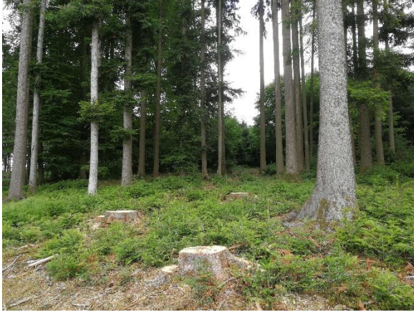
Abb. 9 (rechts): Im Revier Feldaisttal wurden, trotz Schlägerungsarbeiten bis 30 m an den Horstbaum heran, zwei Jungvögel flügge. Gespräche mit dem Forstwirt und der Forstinspektion stoppten weitere Waldarbeiten.

Abb. 8 (links): Schlägerungsarbeiten zur Brutzeit reichten im südlichen Innviertel bis unmittelbar an den Horstbaum. Die Schutzmaßnahmen blieben erfolglos.