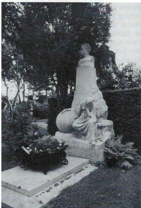
Abb. 10: Das Ehrengrab Dr. HOLUBS auf dem Wiener Zentralfriedhof.

Auf seiner Parte sind auf nicht weniger als 12 Zeilen die HOLUB verliehenen Orden, Medaillen und Verdienstkreuze sowie Ehrenmitgliedschaften aufgezählt (RIZ 1985). Die Presse, die zu seinen Lebzeiten seinen Verdiensten nur wenig Aufmerksamkeit gewidmet hatte, brachte lange Leitartikel.