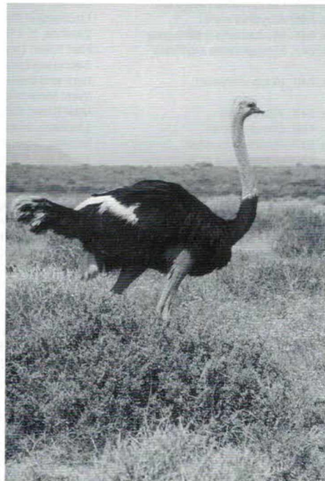
Abb. 5: Afrikanischer Strauß Struthio camelus australis.