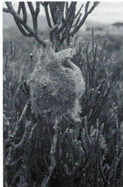
Abb. 4: Nest der Kapbeutelmeise Anthoscopus minutus .

Besonders ausführliche Beschreibungen sind HOLUBS Beobachtungen am „ Südafrikanischen Fahlgeier, Gyps Kolbii “, dem „ Steppen- oder Raubadler, Aquila rapax “, dem „ Sekretär, Serpentarius reptilivorus “, dem „ Gelbschnabeligen Hornvogel, Tockus flavirostris “, dem „ Afrikanischen Strauss, Struthio camelus “ und hier besonders den Straussenfarmen (Abb. 5 und Abb. 6), dem „ Hammerkopf - Scopus umbretta “ und dem „ Gehäubtem Pelikan - Pelecanus mitratus (LICHT.) “ (unter dem damals noch gebräuchlichen Namen, heute Pelecanus onocrotalus ) gewidmet. Genauere Beobachtungen über Durchzug und Abwanderung von Vögeln hat HOLUB vom September und Oktober 1876 aus Linokana zusammen gefasst (HOLUB & PELZELN, p. 154).