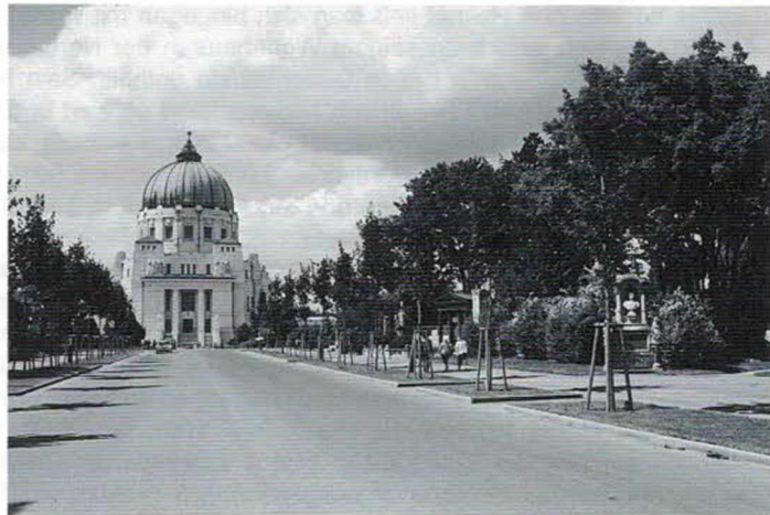
Abb. 9: Die Dr. KARL LUEGER-Gedächtniskirche auf dem Wiener Zentralfriedhof, vor der sich links und rechts die Ehrengräber der Stadt Wien befinden.