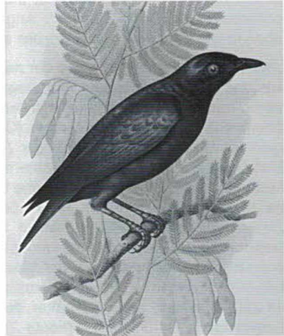
Abb. 3: Grünschwanz-Glanzstar Lamprotornis chalybaeus sycobius . In den Beiträgen wird er als „PETER's Glanzvogel“ genauer behandelt. Aus HOLUB, E. & A. v. PELZELN (1882).

Weiters sind abgebildet „ Meyers Papagei an seinem Nestloch “ (p. 168), das Nest eines Kronkranichs „ in einem Sumpfweiher der Hartsriverebene “, „ der Hammerkopf (Scopus umbretta) und seine Nestbauten “ (p. 279), die „ Flugtouren der Verreaux'schen Flamingos “ (p.p. 308 und 309), eine „ Nilgans sammt Nest “ (p. 325) und Skelette eines Schlangenhalsvogels (p. 335 und 339) sowie die Zungenbeine von nicht weniger als 30 Vogelarten (p. 363 und 365 auf 2 Tafeln).