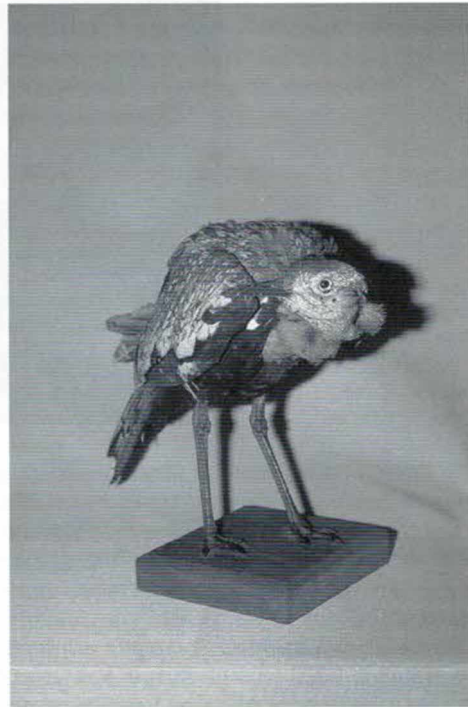
Abb. 7: Rotschopfrappe Lophotis ruficrista , gesammelt von E. HOLUB. Präparat im Naturhistorischen Museum Wien.

Eine ähnliche Ausstellung wie im Wiener Rotundengebäude wurde am 30. April 1892 im Industriepalais in Prag eröffnet, aber HOLUBS Hoffnung auf die Einrichtung eines Afrikamuseums in Prag erfüllte sich nicht. Sogleich nach der Beendigung der Prager Ausstellung erhielt er jedoch zahlreiche Angebote, seine Sammlungen zu verkaufen. Der amerikanische Anthropologe BOAS versuchte HOLUB sogar zu einer großen Ausstellung in Chicago zu überreden und die Kollektionen anschließend zu verkaufen (RIZ 1985: 157). HOLUB lehnte jedoch ab, wurde aber 1894 von der National Geographic Society in die USA eingeladen und hielt während seines bis 1895 dauernden Aufenthaltes u.a. Vorträge in Chicago, New York, Omaha, Milwaukee und St. Paul.