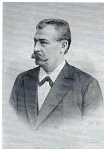
Abb. 1: Dr. EMIL HOLUB.