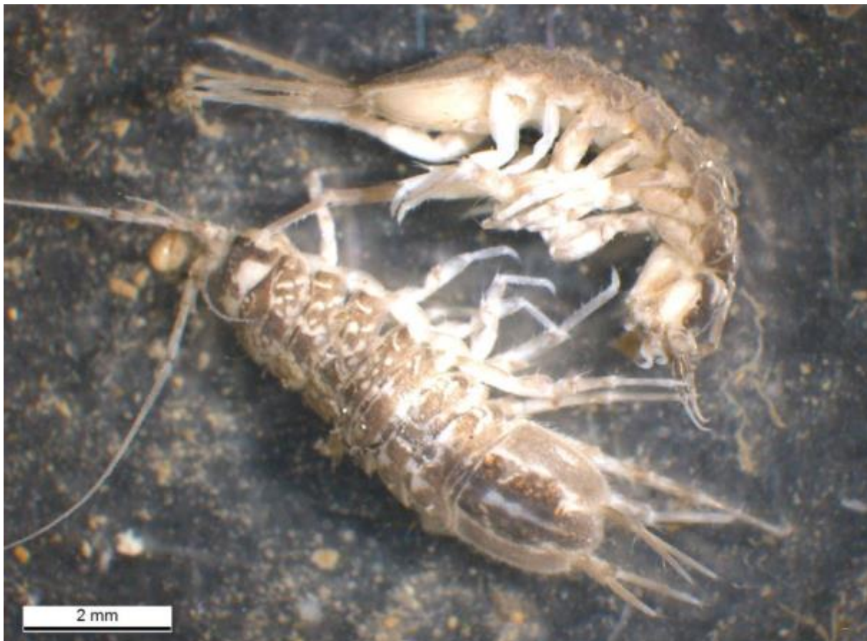
Wasserassel Asellus aquaticus

Zu finden sind sie in stehenden Gewässern wie Seen, Teichen und Tümpeln, aber auch in langsam fließenden Bächen oder Flüssen in Vorarlberg. Die wichtigsten Faktoren sind dabei das Vorhandensein von Unterschlupfmöglichkeiten und geeigneten Nahrungsquellen. Sie ernähren sich hauptsächlich von tierischem und pflanzlichem Detritus – also zerfallender organischer Substanz. Auch Bakterien und Pilze stehen auf ihrem Speiseplan. Selbst das Fressen von toten und sogar lebenden Artgenossen konnte bereits nachgewiesen werden. Sie gelten als „Recycler“ in Ökosystemen. Bei höheren Fließgeschwindigkeiten von über 5 cm/Sekunde siedelt sich die Wasserassel nicht dauerhaft an, obwohl sie sogar gegen den Strom wandern kann. Der Grund liegt darin, dass sich hier schlichtweg nicht genügend Nahrung ablagert. Auch in Bereichen ohne dicken Bewuchs kann keine Besiedlung stattfinden [1].