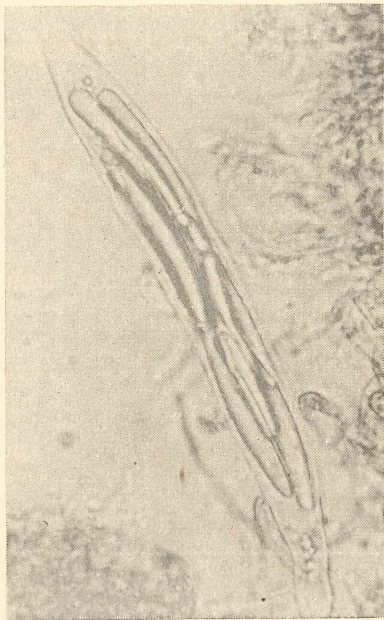
Abb. 2 und 3: Trichoglossum leucosporum , Asci mit Sporen