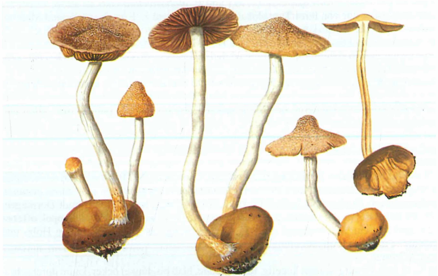
Abb. 8. Psathyrella globosivelata , Körniger Mürlbling. Brandenburg, Naturschutzgebiet am Ortsrand von Dahlewitz, nährstoffreicher Laubwald an der Berliner Stadtgrenze, 10. Oktober 1992, leg. & Aquarell E. LUDWIG.

Lamellentrama mit braunem, membraninkrustierendem Pigment, Schnallen in allen Fruchtkörperteilen vorhanden.