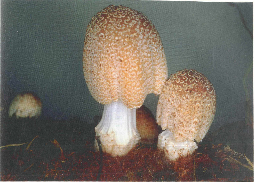
Coprinus ellisii .