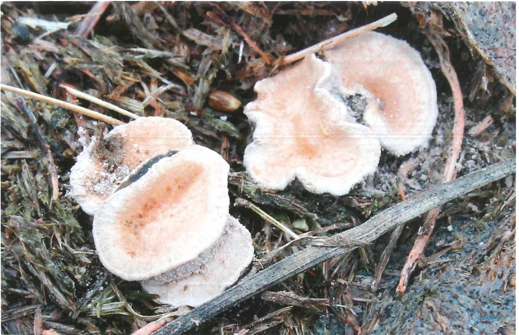
Abb. 3: Conidiogene Stromata am Fundort auf Pferdeexcrementen.