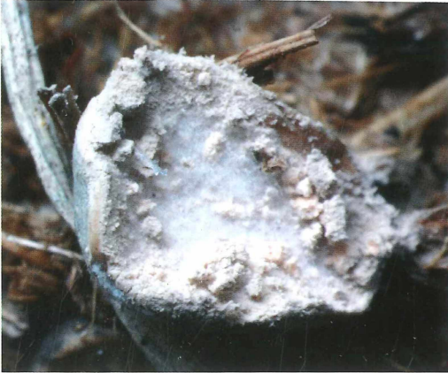
Abb. 4: Blick auf die conidiogene Oberseite eines Stromas (Foto: W. HUTH, 3.1.2013).