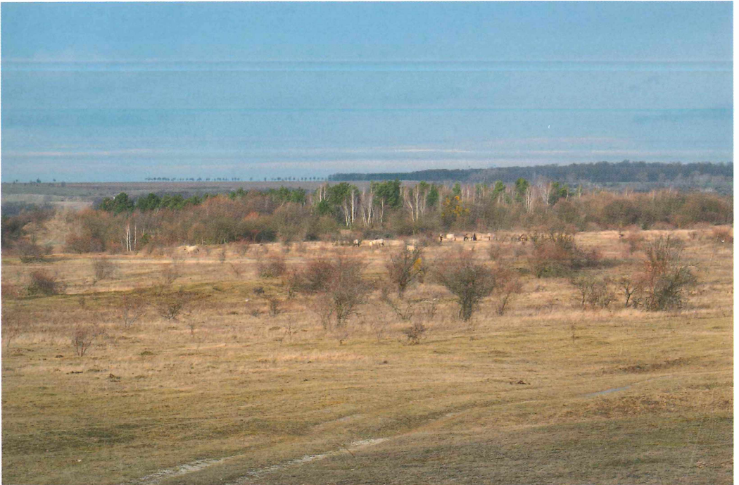
Abb. 1: Weide auf der Hochfläche „Der Rödel“, Fundort von Poronia punctata, in Bildmitte in Miniatur Koniks.