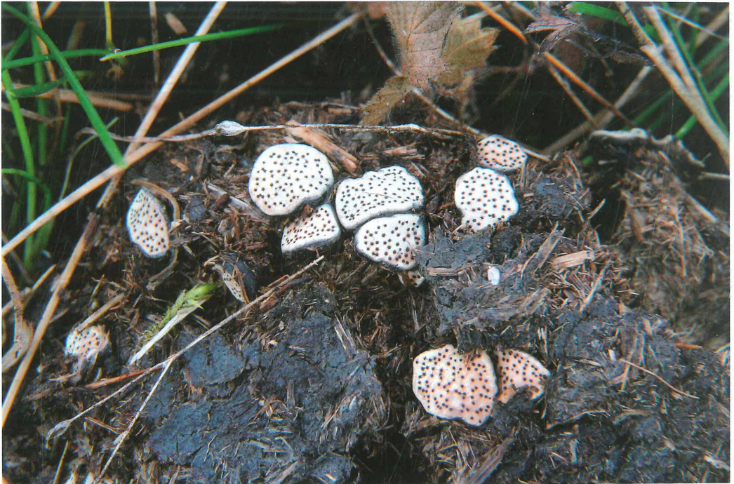
Abb. 2: Stromata mit fertilen Perithezien am Fundort auf Pferdeexkrementen.

Sporen schwarz, in Frontalansicht (Keimspalte median gelegen) ellipsoid, überwiegend (23) 24–26,5 x 12–13 µm (einige Sporen in achtsporigen Asci auffallend schlank, diese bis 29,5 x 11,5 µm), Keimspalte 9,5–11,5 µm lang, frei liegende Sporen von 8,5–11 µm breiter Gallerthülle umgeben (Abb. 7; Sporen aus exsikkierem Material zeigten keine Gallerthülle mehr).