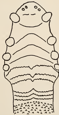
Abb. 1. Verlauf der Gaumenfalten von Scotonycteris zenkeri

Sehr markant und übereinstimmend sind bei allen 4 Stücken die zwischen den Zähnen verlaufenden Falten zu erkennen: eine sehr kräftige, ein wenig nach hinten ausgewölbte Falte, die zum Hinterrand der Canini verläuft, und je eine etwas nach vorn gebogene zwischen den drei Backenzähnen. Die darauffolgenden, schon von Matschie genannten 3 postdentalen Falten, die noch vor dem freien Feld liegen, also noch zur vorderen Faltengruppe gehören, sind nur bei einem Tier voll ausgebildet (Abb. 1). Bei den 2 anderen erwachsenen Stücken ist die mittlere, also 6. Falte nicht ganz ausgezogen. Im ganzen können wir also 7 vordere