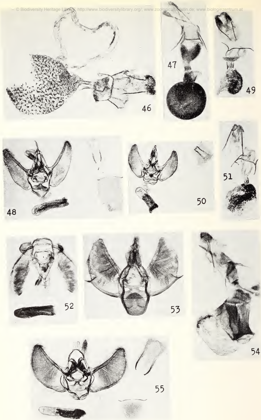
Planche VI. fig. 46 costisignata ♀ prép. 1659.2. D.L. x15 fig. 47 emanata ♀ prép. 1950.595. x15 fig. 48 hilarjata ♂ prép. 1657.1. D.L. x15 fig. 49 hilarjata ♀ prép. 1657.2. D.L. x15 fig. 50 illaborata ♂ prép. 1658.2. x15 fig. 51 illaborata ♀ prép. 1658.3. D.L. x15 fig. 52 lucigera ♂ prép. 3519 x15 fig. 53 recens ♂ prép. 1950.593A x15 fig. 54 recens ♀ prép. 1656.1. D.L. x15 fig. 55 rubellata ♂ prép. 1653.3. D.L. x15