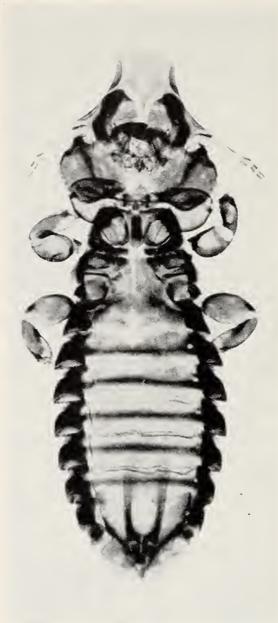
Abb. 1 a.