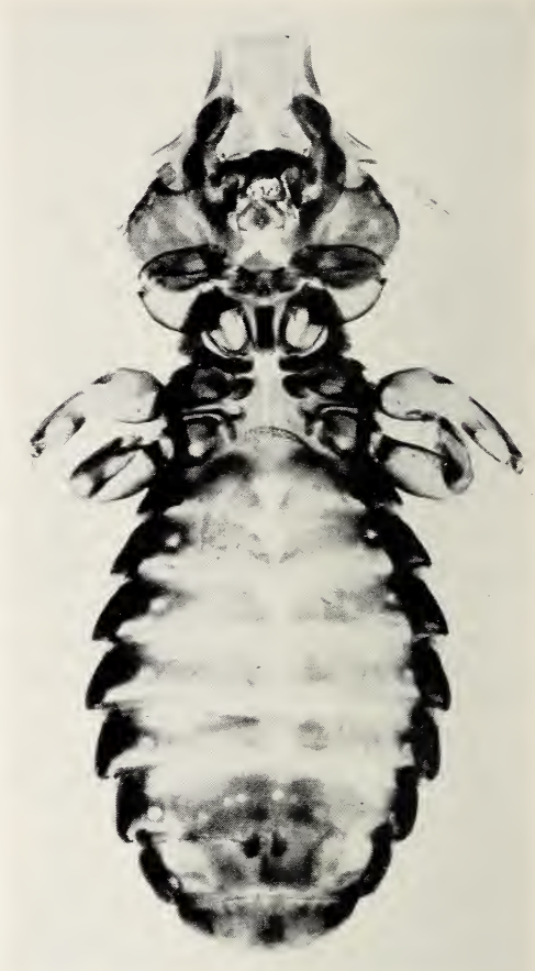
Abb. 1 b.