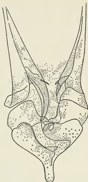
Abb. 2 b.