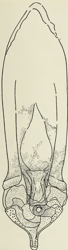
Abb. 2 a.