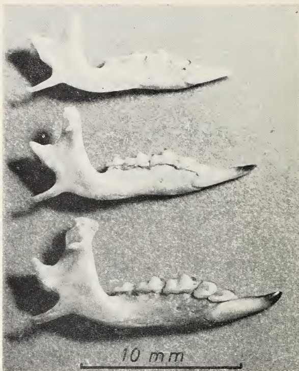
Abb. 3: Unterkiefer, Profilsansicht von außen (von oben nach unten): Neomys a. anomalus (Nord-Spanien), Neomys f. fodiens (Mitteleuropa), Neomys niethammeri (Nord-Spanien).