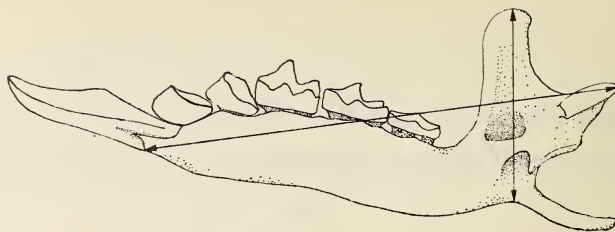
Abb. 1: Neomys -Unterkiefer, Profilansicht von innen mit eingezeichneter Mandibellänge und Coronoidhöhe

Beim Nehmen dieses Maßes ist aber zu berücksichtigen, daß der untere Meßpunkt in einer Hohlkehle liegt: Damit die entsprechende Meßbacke beim Messen nicht hohl aufliegt, darf ihre Innenfläche nicht wesentlich breiter als 0,1 mm sein (aber auch nicht wesentlich schmaler, weil sie sonst sehr leicht Kerben an den Meßpunkten eindrückt).