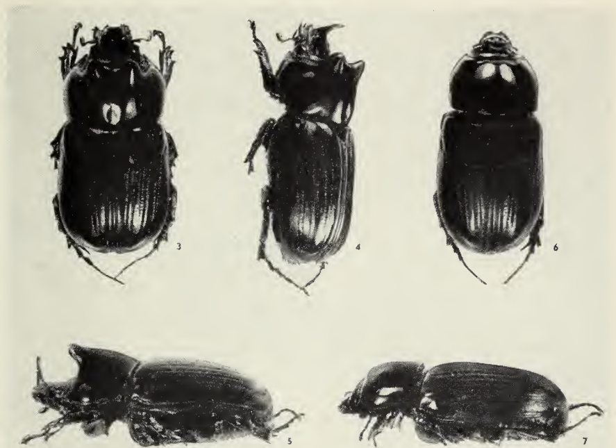
Abb. 3—5. Clysterius guineensis n. sp. Männchen, Abb. 3 Dorsalansicht, Abb. 4 Schrägansicht, Abb. 5 Seitenansicht.