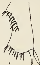
Abb. 2. Spitze der Hinterschienen bei Clysterius guineensis n. sp.

Vorderschienen mit drei Außenzähnen, Vordertarsen beim Männchen mäßig stark verdickt, die innere Klaue viel stärker als die äußere, hakenartig gekrümmt und an der Spitze fein gespalten. Prosternalzapfen freiliegend, hoch. Spitze der Mittel- und Hinterschienen breit und stumpf dreieckig gezackt und gezähntelt, mit starken Endborsten und mit zwei Endspornen (Abb. 2). Mittel- und Hinterfüße einfach, kaum länger als die ent-