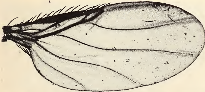
Abb. 5 Megaselia (s. str.) costella n. sp. ♀, Flügel der Type.

Von den Europäern (und wahrscheinlich auch überhaupt) steht ihr crassicosta