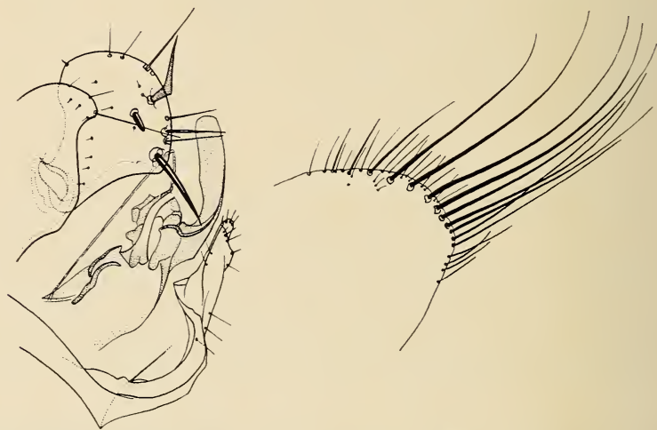
Abb. 2. Amphipsylla montium Jordan, ♂ Allotypus. — Links: Unbeweglicher Fortsatz des Klammerapparates mit Finger, Ende des Aedoeagus und Sternum 9. — Rechts: Distalrand des Sternums 8.

In der Form des „Fingers“ hat A. montium einige Ähnlichkeit mit A. kuznetzovi Wagner, während sie in der Form und Position der Dornen auf dem Finger an A. argoi Ioff erinnert. Der Finger ist sehr breit; sein Proximalrand ist in der basalen Hälfte konkav und trifft mit dem Dorsalrand in einem gerundet stumpfen Winkel zusammen; der Dorsalrand ist schwach konvex und geht in annähernd gleichmäßiger Rundung (Allotypus) oder in einem sehr gerundeten stumpfen Winkel (bei dem anderen Exemplar, s. oben Nr. 12) in den schwach konvexen Distalrand über; der Distalrand und der gleichmäßig schwach konkave Ventralrand bilden eine etwas