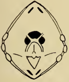
Abb. 2. Rachenzeichnung des Nestlings von Spermophaga ruficapilla

Ein Vergleich dieser Angaben mit solchen über australische Prachtfinken (Immelmann 1962) zeigt, daß hier unter den Prachtfinken zahlreiche Variationen bestehen, die zu untersuchen vielleicht auch taxonomisch von Wert wäre. Bis jetzt sind Beobachtungen hiervon freilich noch zu vereinzelt, um weitergehende Vergleiche anzustellen.