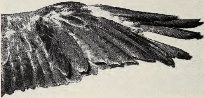
Abb. 2. Linker Flügel mit Doppelflügel.