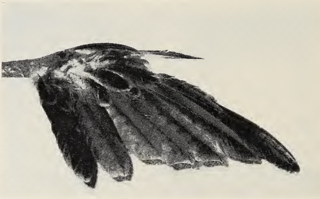
Abb. 3. Doppelflügel durch Unterschieben eines Kartons hervorgehoben.

führen ist oder ob sie überhaupt nicht zur Ausbildung gelangten, läßt sich nicht mehr feststellen, doch dürfte das zweite zutreffen.