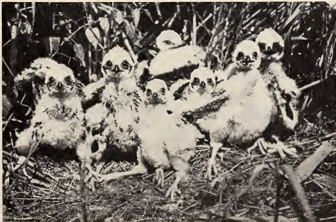
Abb. 2. Rohrweihenbrut mit 7 Jungen 1964 bei Haselbach.

In den übrigen 37 Gelegen blieben 67 von 260 Eiern (25,7 %) ergebnislos. Da die Horste nicht fortlaufend kontrolliert wurden, kann über die Art der Verluste leider nichts ausgesagt werden. Sie können Eier betreffen, die nach der letzten Gelegekontrolle aus dem Horst gerollt, zerbrochen wurden