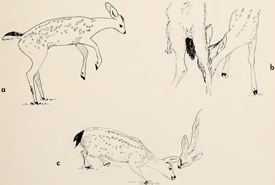
Abb. 3: Spiel-Bewegungen bei Schwarzwedelhirschen. a) Springen (♂); b) Drehstoßen (♂); c) Halsverdrehen (♀).

Die Beobachtungen und Versuche zeigen die engen Beziehungen zwischen dem instinktiven Spiel und dem allgemeinen Aktivitätsniveau beim Schwarzwedelhirsch. Spiel tritt während der täglichen Aktivitätsgipfel auf. Je länger eine Aktivitätsphase ist, desto wahrscheinlicher wird das Vorkommen von Spielverhalten (Abb. 2). Die Tiere spielen besonders häufig, nachdem sie geschlafen, gekotet, uriniert und gefressen haben und noch nicht müde sind. Eine Serie von Spielbewegungen folgt sehr oft auf ruhiges Umherstehen, Sich-Lecken oder Sich-Kratzen, dem Zustand des „entspannten Feldes“ (Bally 1945). Groos (1930) und Meyer-Holzappel (1956) haben einen „unspezifischen Betätigungsdrang“ als Quelle des Spiels angenommen. Die Ethologie hat bisher einer „unspezifischen Tendenz zum Aktivsein“ skeptisch gegenübergestanden. Daher wurde wiederholt ein spezieller „Spieltrieb“ postuliert (z. B. Brownlee 1954). Ob Spiel eine eigene