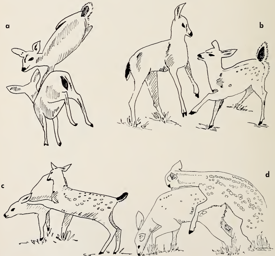
Abb. 4: Weitere Spiel-Bewegungen: a) Rennen mit gegenseitigem Abfangen; b) ♀ (links) erhebt sich, um ♂ zu hufen; c) ♀ huft ♀; d) Aufreiten eines ♂ auf ein ♀.

Motivation besitzt, muß von Art zu Art neu untersucht werden. Zumindest für den Schwarzwedelhirsch muß die Frage eher verneint werden, da Spielentzug nicht zu gesteigerter Spielbereitschaft führte. Die stattdessen beobachteten längeren Aktivitätsphasen, mehr Umherlaufen und Explorieren, zeigen den fakultativen Charakter des Spiels. Zumindest für eine begrenzte Zeit gibt es Alternativen, durch die sich der angenehme „allgemeine Aktivitätsdrang“ ausdrücken kann. Freilebende junge Schwarzwedelhirsche, die wir in der Hastings Reservation der Universität von Kalifornien beobachteten, liefen beim Äsen weit mehr als unsere Versuchstiere im Gehege und spielten dafür weniger. Umgekehrt kam eines unserer handaufgezogenen Weibchen meist nur ganz kurz zum Trinken aus seinem Lager hervor, aber sprang und rannte stattdessen vehement während dieser kurzen Aktivitätsphasen.