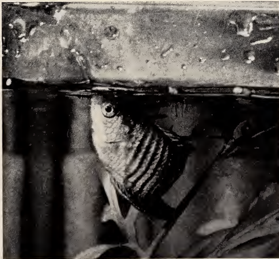
Abb. 4. Spuckender Zwergfadenfisch. Beachte den Spuckstrahl; die anderen Tropfen kleben an der Frontscheibe des Aquariums.

Interessant ist in diesem Zusammenhang eine Beobachtung von H. Hoffmann an einem Colisa chuna -Männchen am Schaumnest: „Es stellte sich wie zum Schaumerzeugen mit der Oberlippe über den Wasserspiegel und spie dann rasch hintereinander einige Wassertropfen mit heftigen Kaubewegun-