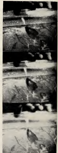
Abb. 2. Spuckendes Zwergfadenfisch-Männchen. 3 aufeinanderfolgende Einzelspucker aus Schmalfilm im Abstand von \frac{1}{4} Sek. Beachte Steilerstellen des Fisches und die dadurch veränderte Spuckrichtung.