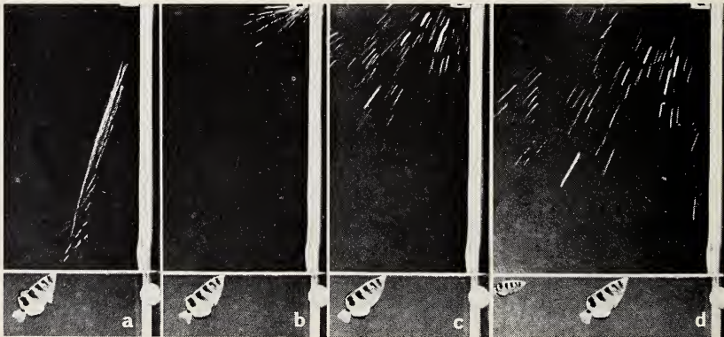
Abb. 2. Spuckablauf bei Toxotes jaculatrix in vier hintereinander folgenden Phasen auf eine Überwasserbeute. Beachte die Höhe und Vehemenz des Spuckens (abprallende Spuckspritzer).

Die Treffsicherheit in erreichbaren Höhen ist bei der C. lalia weit geringer als bei T. jaculatrix (nicht eingerechnet ganz juvenile Tiere, deren Spuckleistungen noch nicht zur Vollendung geübt sind), wo ich bei Beute auf einer planen Unterlage, die zum Wasserspiegel senkrecht stand, 45,5% genaue Treffer gleich bei der ersten Spuckgarbe feststellte.