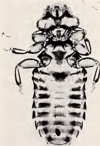
Abb. 3. Myrsidea a. australiensis n. sp. et ssp. ♀ Holotypus, ventral.

Diese Unterart stimmt in allen charakteristischen Merkmalen mit der Nominatform weitgehend überein. Sie unterscheidet sich jedoch von ihr durch die Körpermaße (♂ und ♀) und die abdominale Beborstung, vor allem in der signifikant geringeren Anzahl der pleuralen Setae (♂ und ♀). Weitere statistische gesicherte Unterschiede sind aus Tab. 5 zu ersehen.